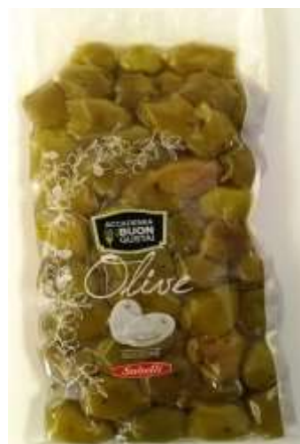
B830 - OLIVE VERDI DEN. PICC GR 400