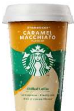
ES8175 - CAMEL MACCHIATO ML 220 (10 PZ)