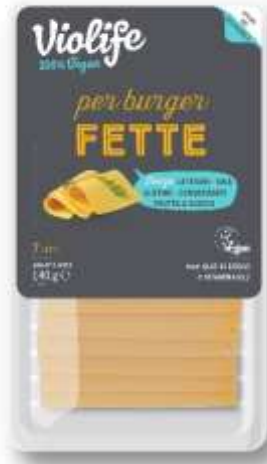
ES2025 - FETTE PER BURGER VEGAN GR 140