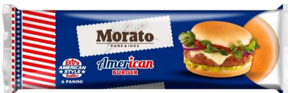
W0533 - AMERICAN BURGER GR 300 X 9