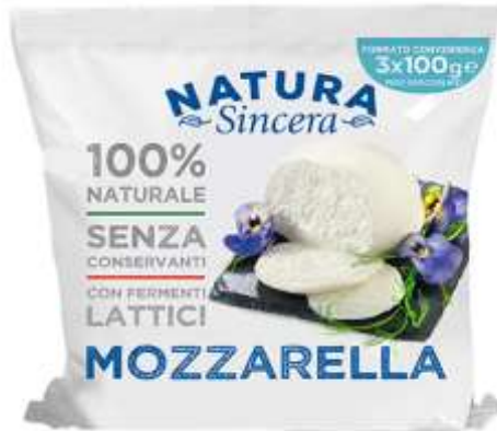
LA401 - MOZZARELLA TRIS GR 100 X 3 X 8 PZ