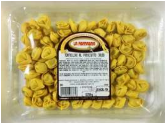
LR345 - TORTELLINI AL PROSCIUTTO GR 250 X 12