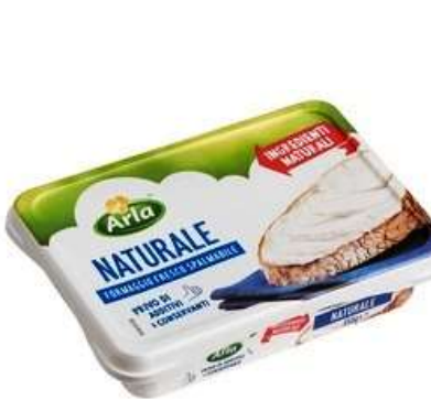
AF573 - SPALMABILE GR 150 X 10