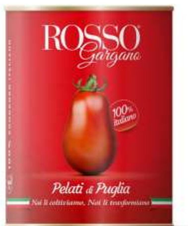
RG06 - PELATO GR 400 X 24 EASY OPEN

Il pomodoro ha avuto in sorte di trovare nella terra di Puglia le condizioni più adatte per crescere assetato d'acqua e con dentro tutto il sole del sud