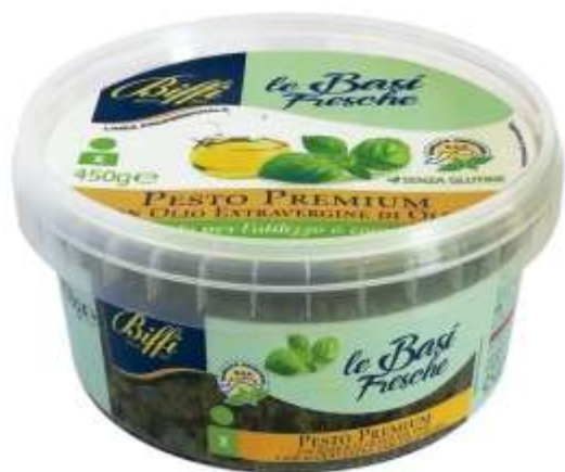
T0036 - PESTO PREMIUM GR 450