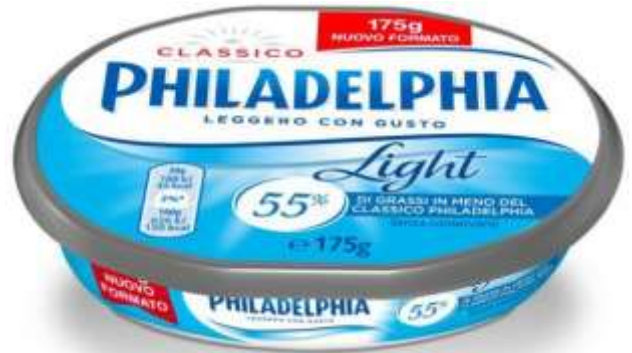
K279 - PHILADELPHIA LIGHT GR 175