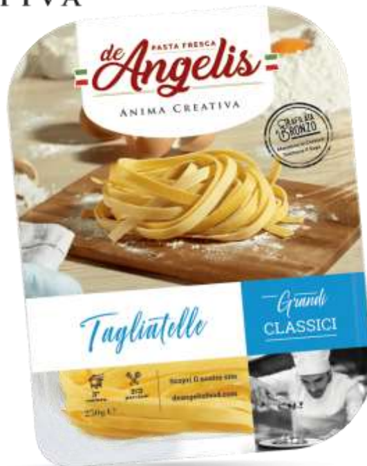
DA0256 - TAGLIATELLE ALL'UOVO GR 250 ( 8 PZ) EAN 8021228310018