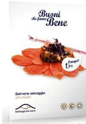
R522 - SELVAGGIO GR 100