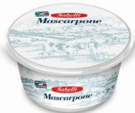
L47 - MASCARPONE SABELLI GR 250 (12 PZ)