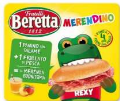
SB918 - MERENDINO BERETTA