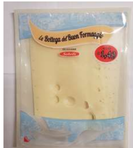
G756A - MAASDAM GR 70X6