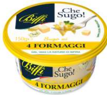
T0022 - 4 FORMAGGI GR 150 EAN 80073222