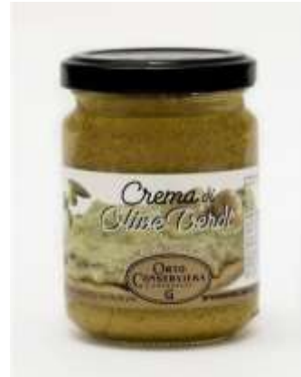
OR07 - CREMA DI OLIVE VERDI GR 130 X 12