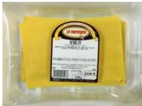
LR729 - LA SFOGLIA GR 250 X 12