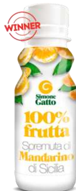
ITALIAN FOOD AWARDS 2020 SG08 - SUCCO DI MANDARINO ML 200 X 8 EAN 8006116121235 SG14 - MANDARINO ML 480 X 8 EAN 8006116121433