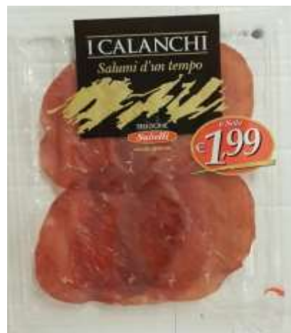
G704A - BRESAOLA GR 40