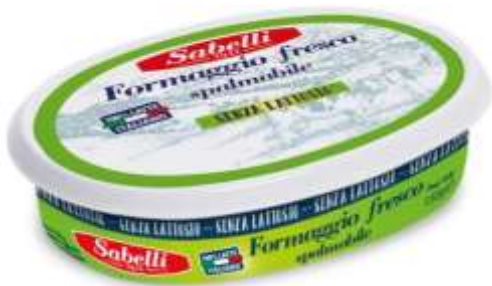
L257 - FORMAGGIO SPALMABILE S/LATTOSIO GR 100 X 8