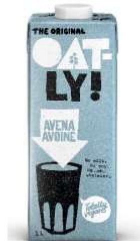
ES3689 - BEVANDA VEGETALE AVENA ARRICCHITA LT 1