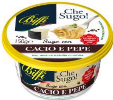
T0027 - CACIO E PEPE GR 150 EAN 80073277