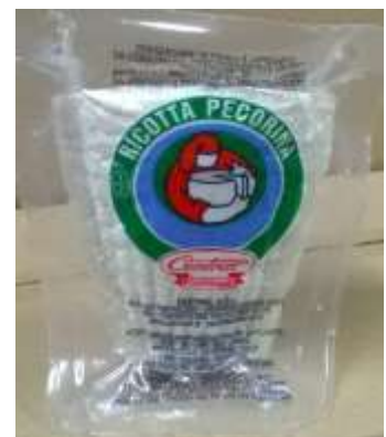
C5500 - RICOTTA SALATA GR 300 S.V.