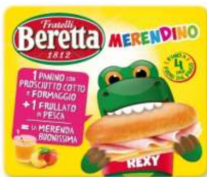
SB618 - MERENDINO BERETTA