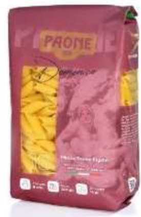
PP416 - MEZZE PENNE RIGATE GR 500 X 20