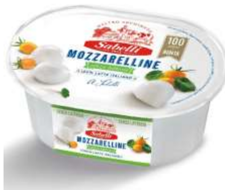
L246 - MOZZARELLINE S/LATTOSIO GR 125 X 8