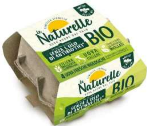
EU4752 - NATURELLE BIO X 4 (24 PZ X CT)