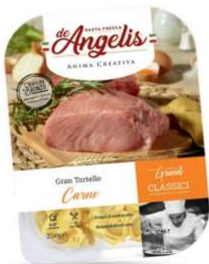
DA0012 - GRAN TORTELLO CARNE GR 250 (8 PZ) EAN 8021228110014