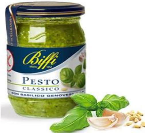
T2713 - GR 190 D.O.P. SENZA GLUTINE X 6