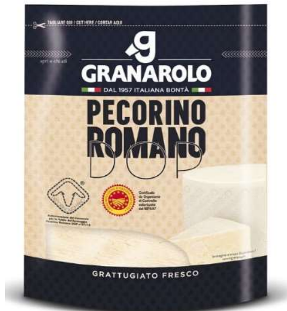
X0841 - PECORINO DOP GRATT. GR 70 X 10