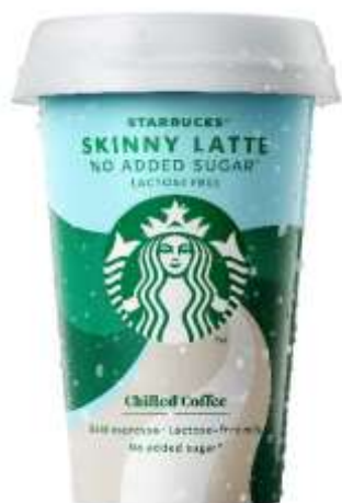
ES8171 - SKINNY LATTE S/ LATTOSIO ML 220 ( 10 PZ)