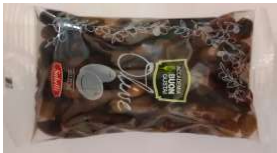
B834 - OLIVE ITRANE GR 400