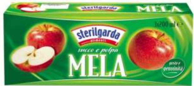
ST12 - SUCCO MELA ML 200 X 3