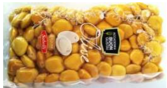
B832 - LUPINI GR 400