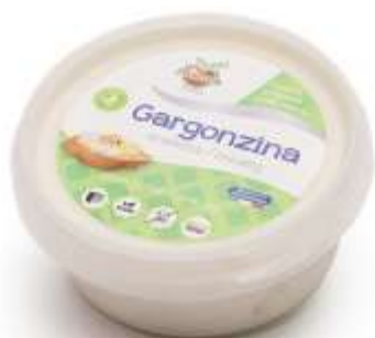
AM07 - GARGONZINA - VEGAN FORM. ERBORINATO GR 170