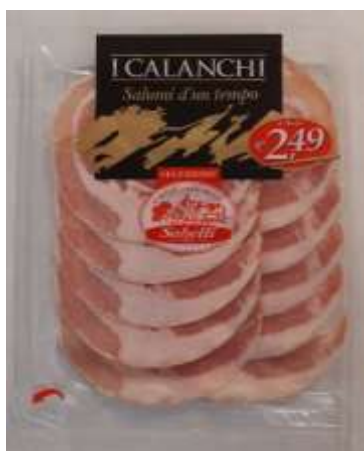
G712A - PANCETTA ARR. GR 80 X 10