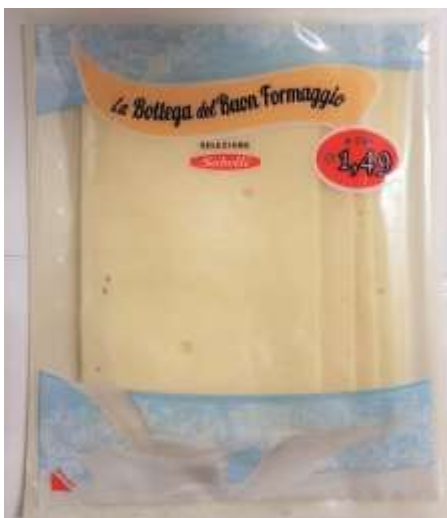
G755A - EDAMER GR 70X6