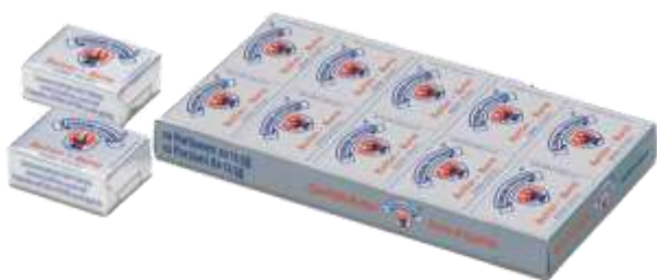
U7851 - BURRO HOTEL VIPITENO GR 12,5X10