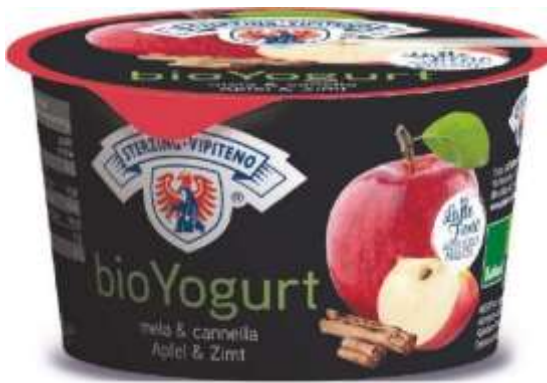
U5818 - YOGURT BIO INTERO MELA E CANNELLA GR 250 X 6