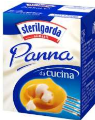
ST16 - PANNA ML 200 X 24