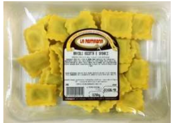
LR348 - RAVIOLI RIC/SPIN. GR 250 X 12