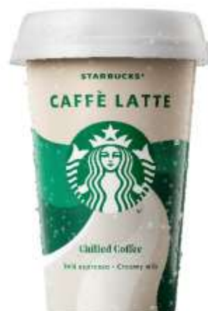
ES8173 - CAFFELATTE ML 220 (10 PZ)