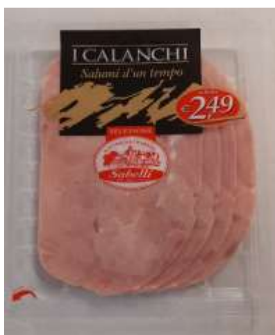
G702A - COTTO GR 110