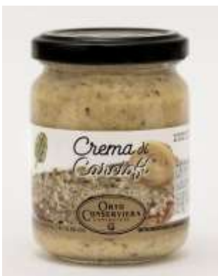
OR09 - CREMA DI CARCIOFI GR 130 X 12