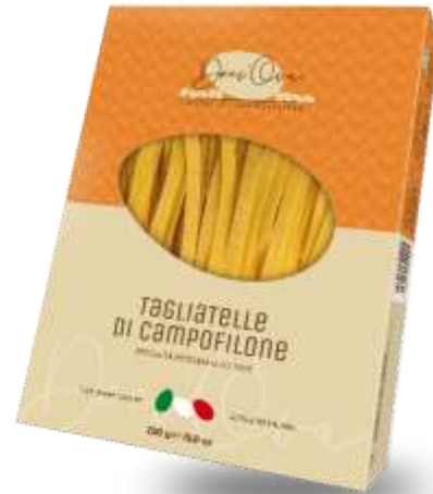
DO24 - TAGLIATELLE DI CAMPOFILONE GR 250