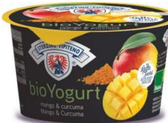
U5827 - YOGURT BIO INTERO MANGO E CURCUMA GR 250 X 6