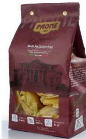
PP437 - NIDI FETTUCCINE GR 500 X 12