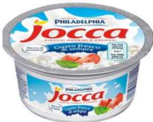
K514 - JOCCA GR 175