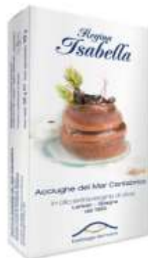
R5100 - FIL. ACCIUGHE CANTABRICO GR 50