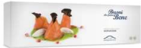
R2055 - BAFFA SCOZZ. PREAFF. 1 KG R3055 - BAFFA NORVEGESE PREAFF. 1 KG R2141 - BOTTEGA NORVEGESE GR 80 R1143 - BOTTEGA NORVEGIA GR 160