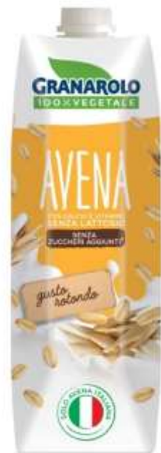
X50190 - BEVANDA DI AVENA LT 1 X 6