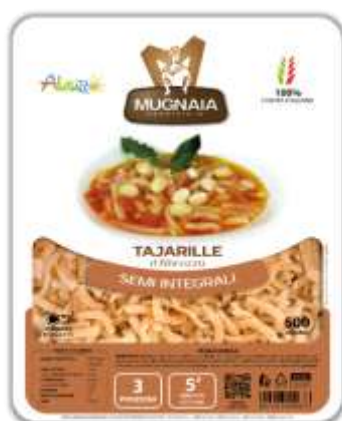
PM10 - TAJARILLE DI EICE GR 500X10