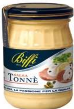
T0404 - TONNE' GR 136