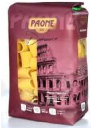
PP435 - MEZZE MANICHE GR 500 X 20

Qualità Premium, questa linea di Pasta trasmette i 140 anni di esperienza di Paone e il legame viscerale con la cultura italiana.