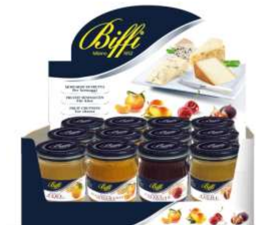
T2744 - EXPO MOSTARDE MISTI GR 100