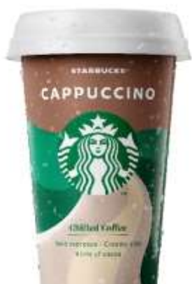
ES8174 - CAPPUCINO CUP ML 220 (10 PZ)