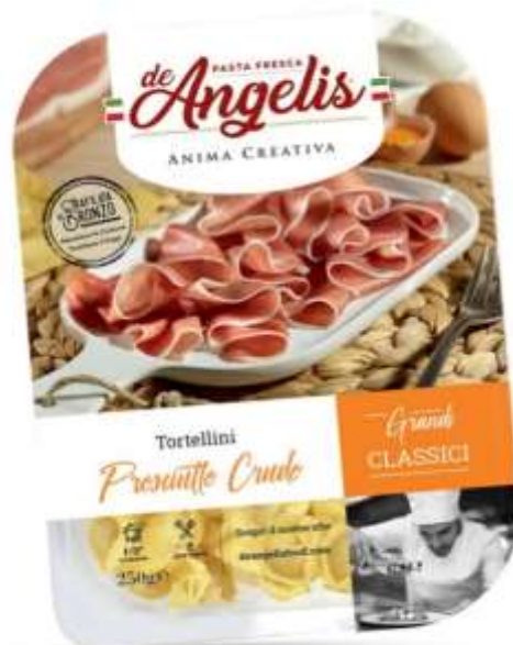
DA0337 - TORTELLINI AL PROSCIUTTO CRUDO GR 250 (8 PZ) EAN 8021228110007