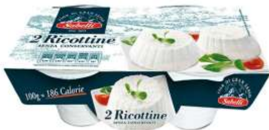
L396 - RICOTTINE GR 100 X 2 (8 PZ)