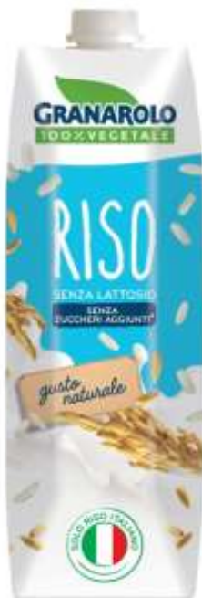
X50194 - BEVANDA DI RISO LT 1 X 6