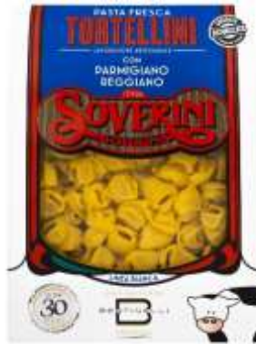
TS2 - TORTELLINI RICOTTA E PARMIG. REGGIANO GR 250 EAN 8027547200023