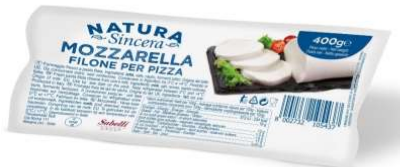
LA433 - MOZZARELLA PANETTO GR 400 (10 PZ)