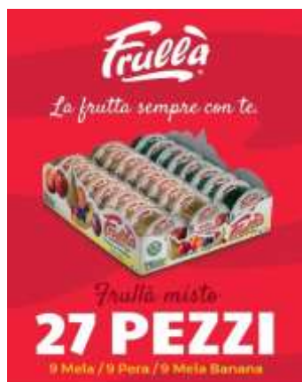
NN270 - EXPO MISTO 27 PZ