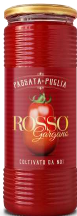
RG09 - PASSATA GR 690 X 12