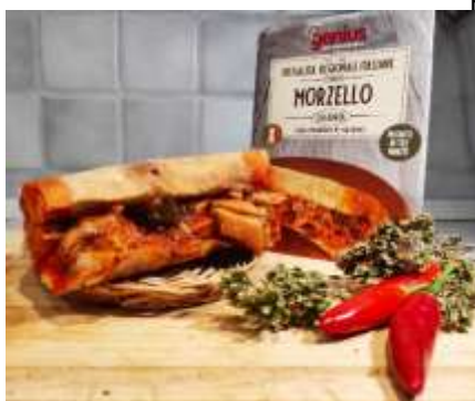
GE300 - MORZELLO GR 500 EAN 8033726523005