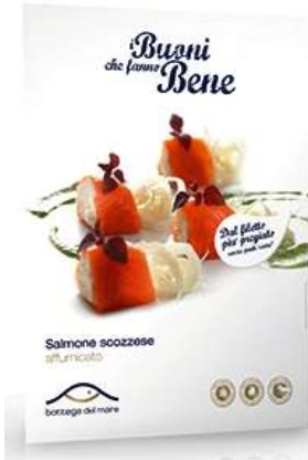
R1121 - SCOZZESE GR 80 R1123 - SCOZZESE GR 160