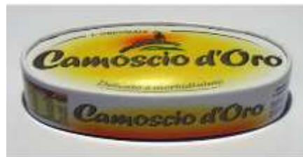
Q5119 - CAMOSCIO D'ORO GR 200 X 8