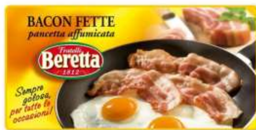
SB63 - BACON FETTE GR 100