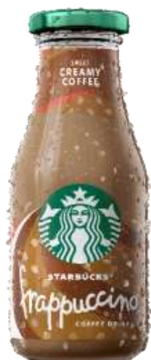
ES8177 - FRAPPUCINO COFFEE DRINK ML 250 (8 PZ)