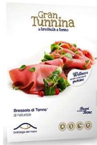
R9742 - FETTE DI TONNO AL NATURALE GR 80