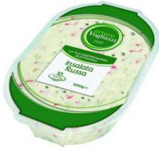
PF095 - INSALATA RUSSA 1 KG