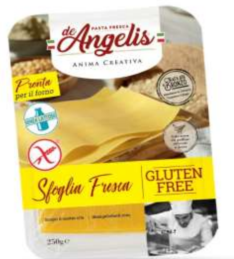
DA1760 - SFOGLIA ALL'UOVO GR 250 X 6 € 2,95/PZ EAN 8021228901643