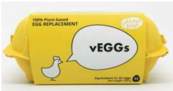
ES2048 - SOSTITUTIVO VEGANO ALL'UOVO GR 102