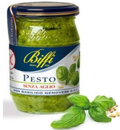
T2716 - GR 190 D.O.P. S/GLUTINE X 6