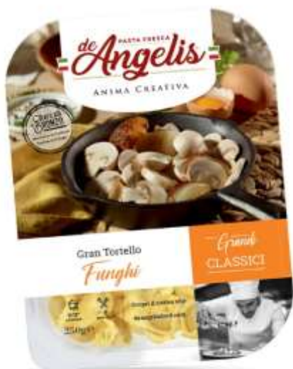
DA0308 - GRAN TORTELLO FUNGHI GR 250 (8 PZ) EAN 8021228410053