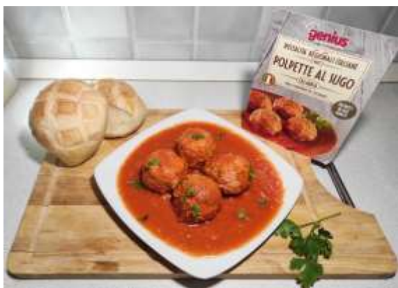
GE173 - POLPETTE AL SUGO GR 500 EAN 8033726523173

SELEZIONIAMO INGREDIENTI DI PRIMA QUALITA' PER IL RECUPERO DI ANTICHI SAPORI BONTA' DALLA CALABRIA AL MONDO