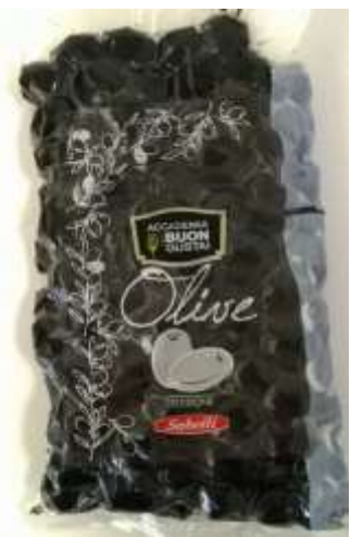
B829 - OLIVE AL FORNO GR 400