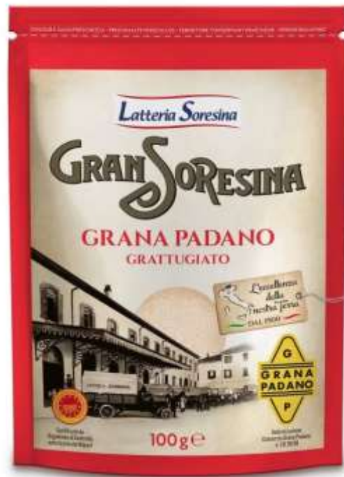
S3904 - GRANA PADANO GR 100 X 16