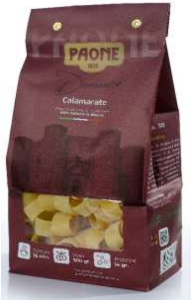
PP430 - CALAMARATA GR 500 X 12