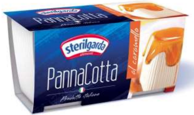
ST22 - PANNA COTTA CAMELLO 90 GR X 2