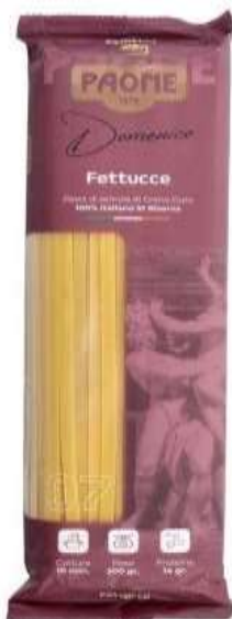
PP407 - FETTUCCE GR 500 X 20