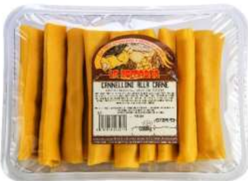
LR327 - CANNELLONI DI CARNE GR 500 X 6