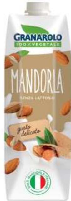
X50195 - BEVANDA DI MANDORLA LT 1 X 6