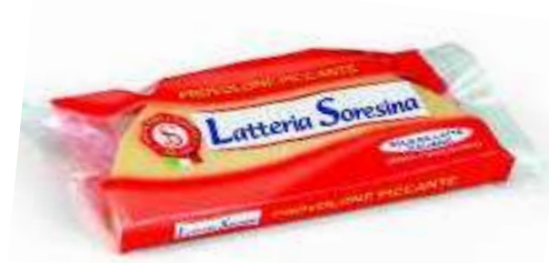
S3304 - PICCANTE GR 250