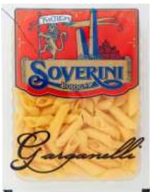
TS60 - GARGANELLI ALL'UOVO GR 250 EAN 8027547100606