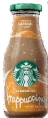
ES8179 - FRAPPUCINO COFFE DRINK CAMEL ML 250 (8 PZ)