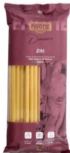
PP408 - ZITI GR 500 X 12