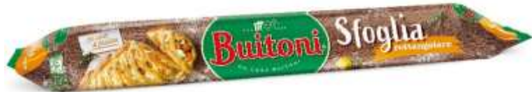
NF124 - GR 230