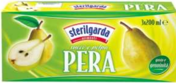
ST 08 - SUCCO PERA ML 200 X 3