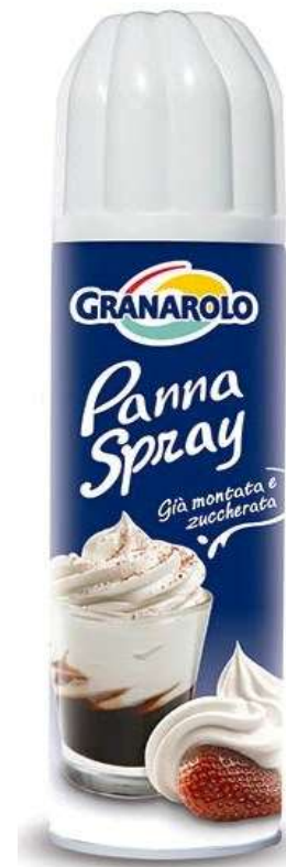
X4400 - PANNA SPRAY GRANAROLO ML 250 X 12