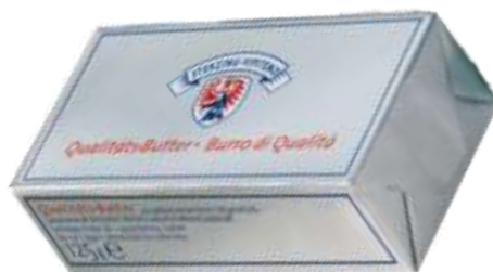
U7852 - BURRO VIPITENO GR 125