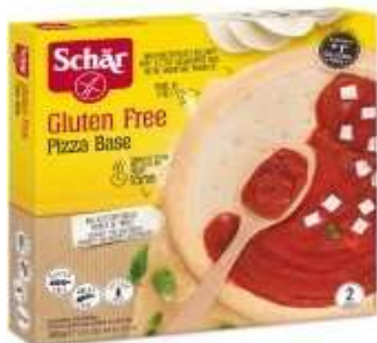
DS101 - PIZZA PER BASE GR 300 X 8