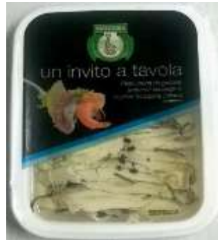
B206 - FILETTI DI ALICI GR 200