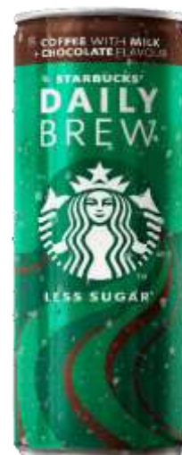
ES8188 - CAFFELATTE CIOCC LATTINA ML 250 (12 PZ)