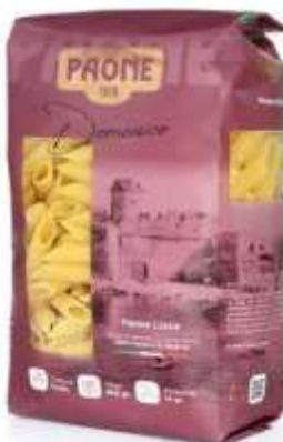
PP419 - PENNE LISCE GR 500 X 20