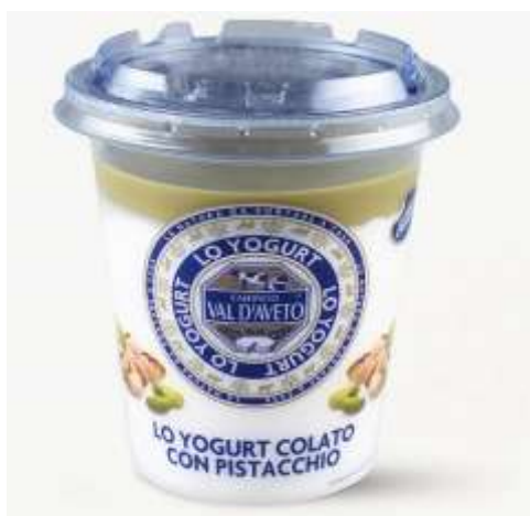
VA268 - PISTACCHIO

Una vocazione legata al territorio ligure.