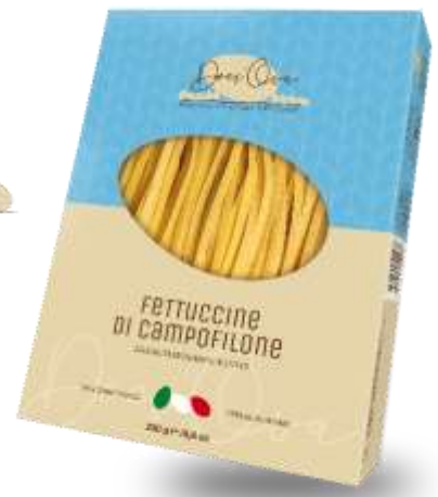
DO23 - FETTUCCINE DI CAMPOFILONE GR 250 DO243 - FETTUCCINE DI CAMPOFILONE KG 1