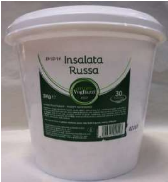
V3310 - INSALATA RUSSA VOGLIAZZI KG 3