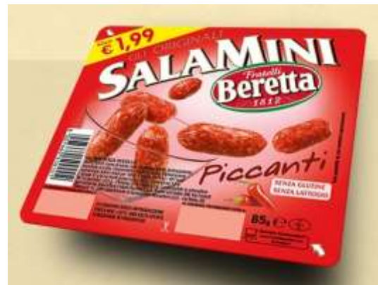
SB150 - SALAMINI PICCANTI