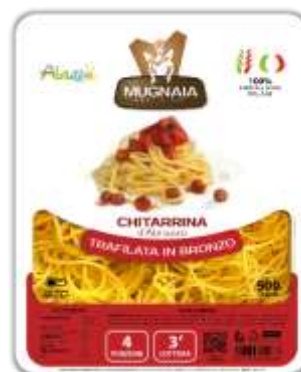
PM07 - CHITARRINA D'ABRUZZO GR 500 X 10