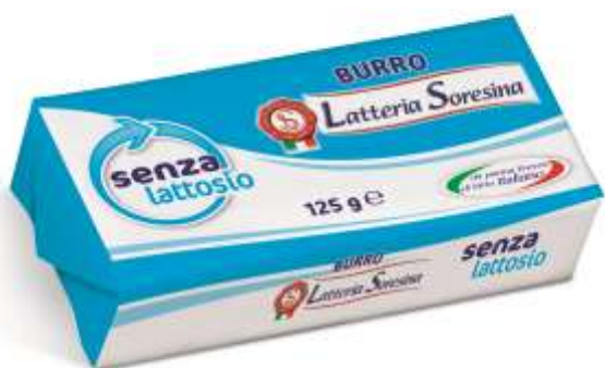
S3634 - BURROS/LATTOSIO GR 125