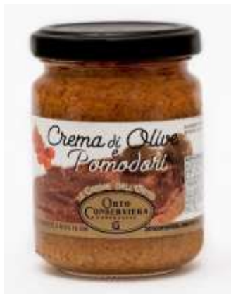
OR10 - CREMA DI OLIVE/POMODORI GR130X12