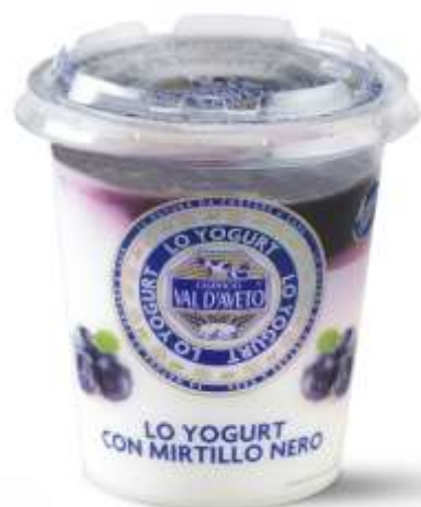
VA255 - MIRTILLO NERO