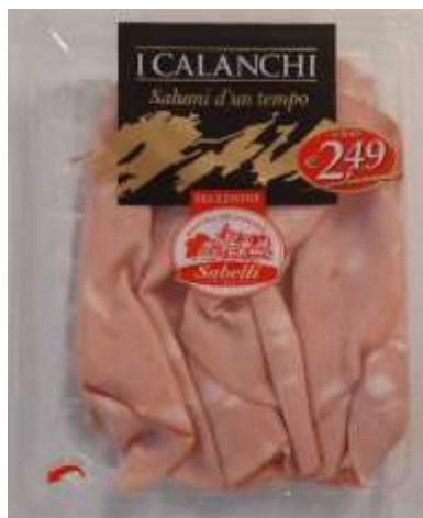
G703A - MORTADELLA GR 110