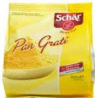
DS604 - PAN GRATI GR 300 X 6