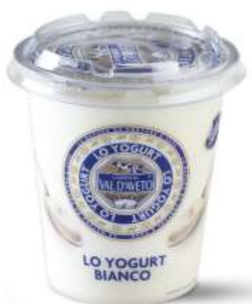
VA279 - BIANCO