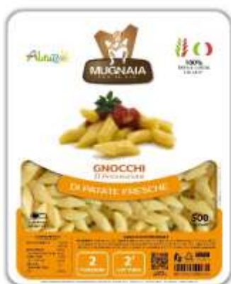
PM03 - GNOCCHI D'ANNUNZIANI GR 500X10