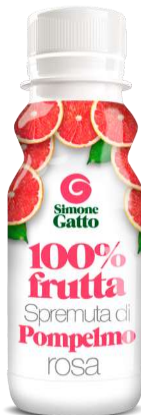
SG09 - SUCCO DI POMPELMO ROSA ML 200 X 8 EAN 8006116121297