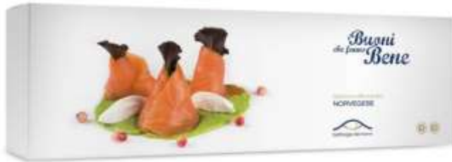
R306 - BAFFA INT. NORVEGESE KG 2