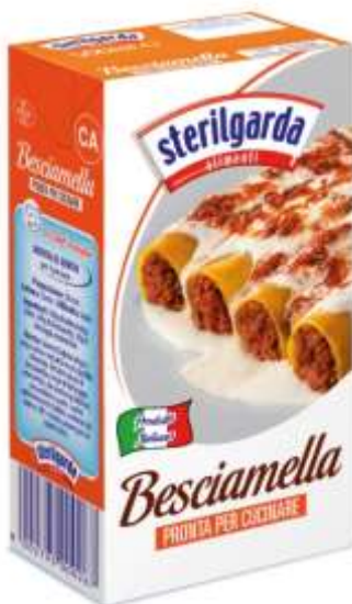
ST19 - BESCIAMELLA ML 200 X 24 ST20 - BESCIAMELLA ML 500 X 12