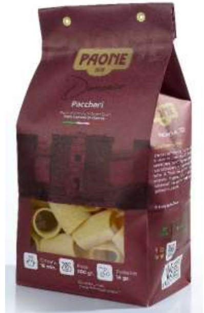
PP432 - PACCHERI GR 500 X 12