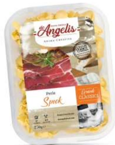
DA0318 - PERLE CON SPECK GR 250 ( 8 PZ ) EAN 8021228410138