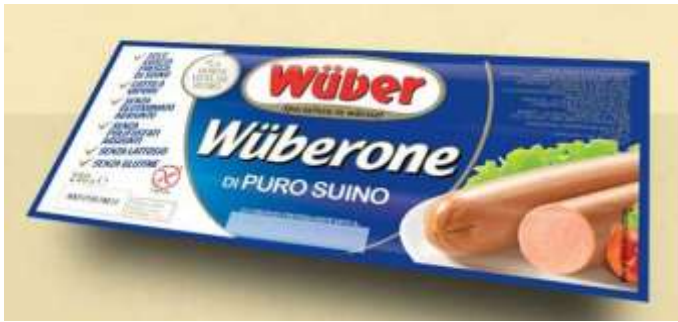
SB25 - WUBERONE SUINO GR 250