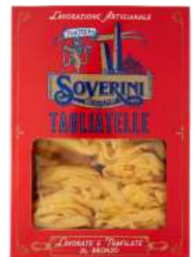
TS73 - TAGLIATELLE ALL'UOVO GR 250 EAN 8027547100736