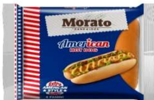
W0528 - AMERICAN HOT DOG GF