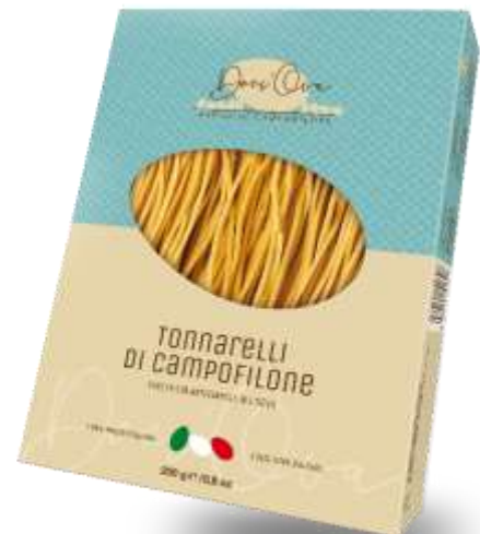
DO26 - TONNARELLI GR 250