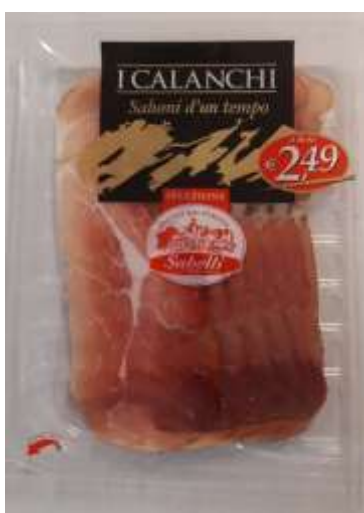
G709A - SPECK GR 80