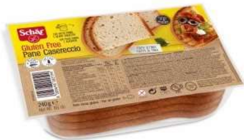
DS001 - PANE CASARECCIO GR 240 X 5