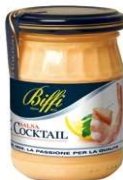
T0114 - COCKTAIL GR 136