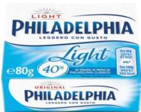
K240 - LIGHT GR 80 X 8