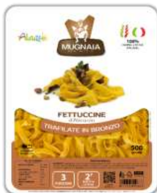
PM08 - FETTUCINE DI ELICE GR 500 X 10