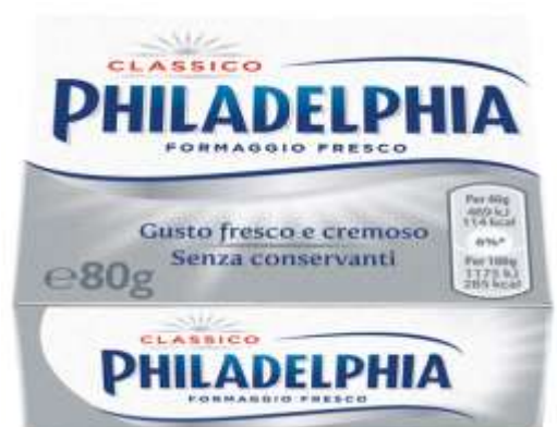
K326 - CLASSICA GR 80 X 8