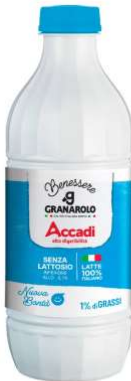
9601 - LATTE ACCADI LT 1 X 6