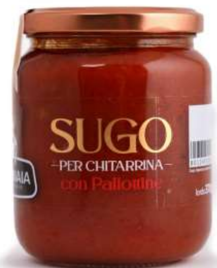
Con polpettine PM26 - SUGO ALLA CHITARRINA GR370 X 12