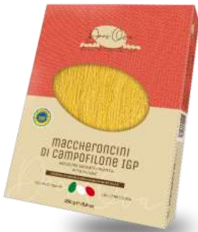
DO21 - MACCHERONCINI DI CAMPOFILONE IGP GR 250 DO241 - MACCHERONCINI DI CAMPOFILONE IGP KG 1