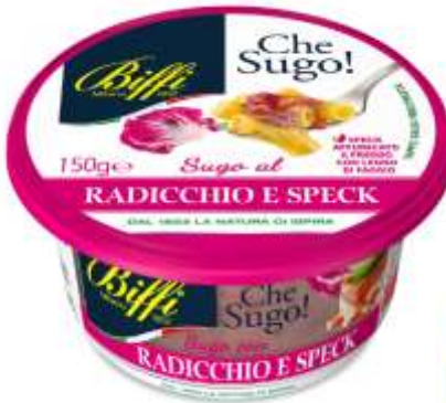
T0015 - SUGO FRESCO RADICCHIO E SPECK GR 150 EAN 80073154