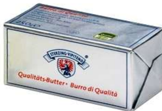
U7853 - BURRO VIPITENO GR 250