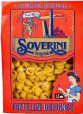
TS1 - TORTELLINI BOLOGNESI GR 250 (10 PZ) EAN 802754700012