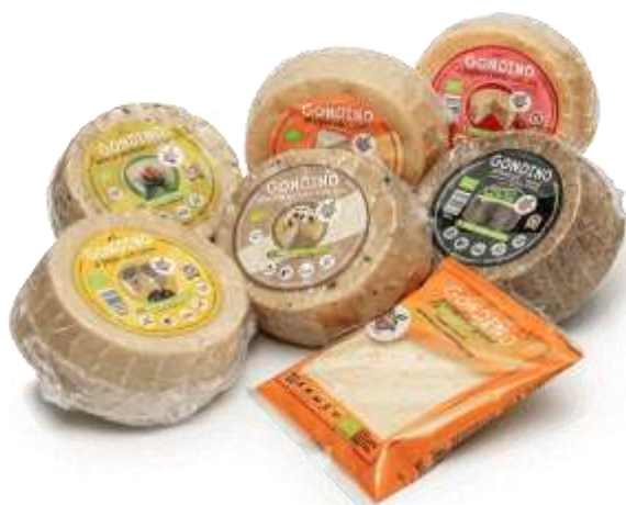
AM09 - GONDINO GRATTUGGIATO GR 75