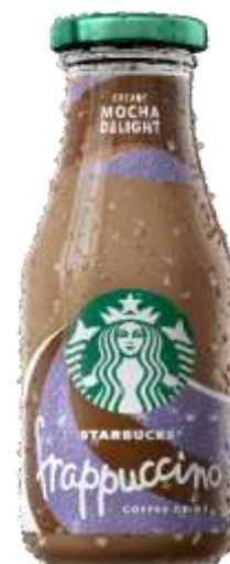
ES8178 - FRAPPUCINO COFFE CIOCCOLATO ML 220 (8 PZ)