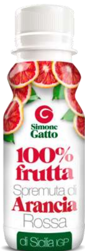
SG06 - SUCCO DI ARANCIA ROSSA SICILIA IGP ML 200 X 8 EAN 8006116125226