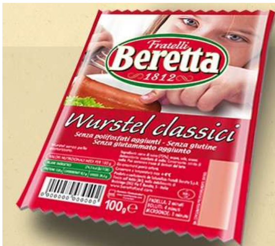
SB90 - WURSTEL SUINO GR 100