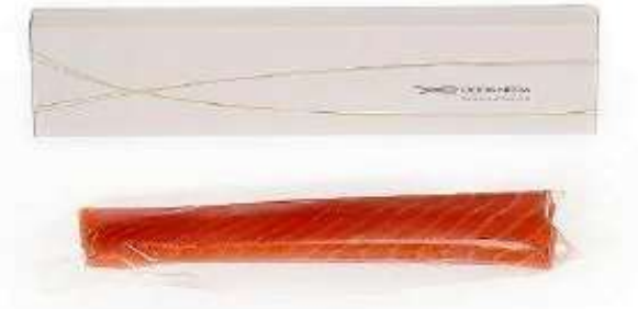
R2501 - FILETTO DI CODA NERA GR 170