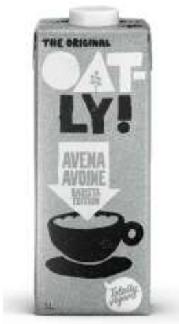
ES3688 - BEVANDA VEGETALE AVENA BARISTA LT 1