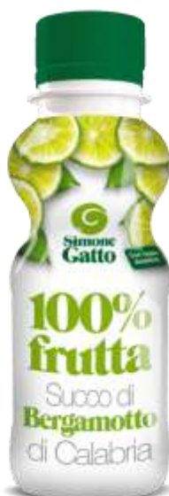
SG02 - SUCCO DI BERGAMOTTO ML 100 X 10 CON DOSATORE A GOCCIA EAN 8006116121150