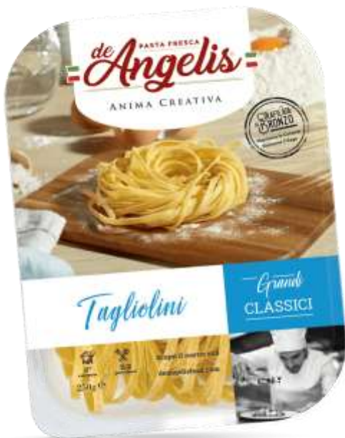
DA0259 - TAGLIOLINI ALL'UOVO GR 250 (8 PZ) EAN 8021228310025