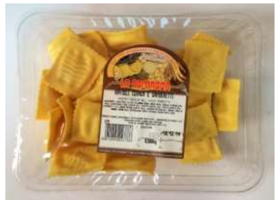
LR377 - RAVIOLI DI BUFALA GR 500 X 6