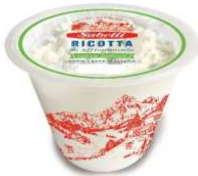
L294 - RICOTTA T.A. S/LATTOSIO GR 170 X 6