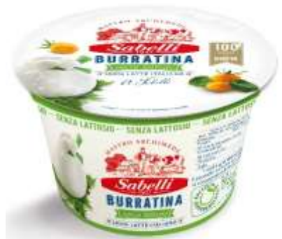
L222/S222 - BURRATINA S/LATTOSIO GR 125 X 8