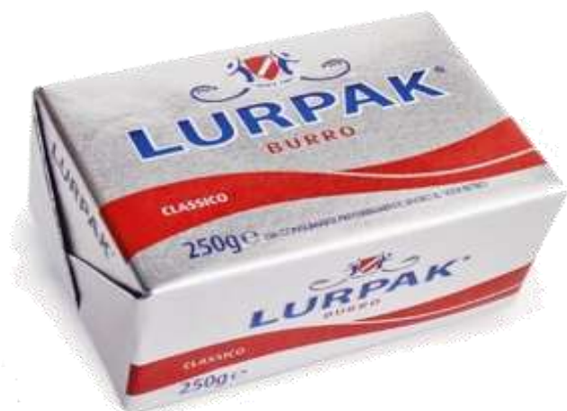
AF333 - BURRO LURPAK CLASSICO GR 250