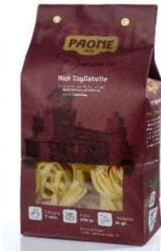
PP436 - NIDI TAGLIATELLE GR 500