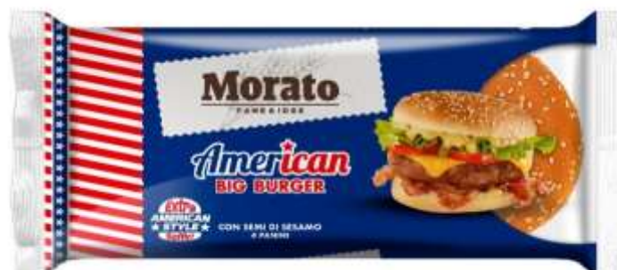
W0532 - AMERIC. BIG BURGER GR 300 X 10