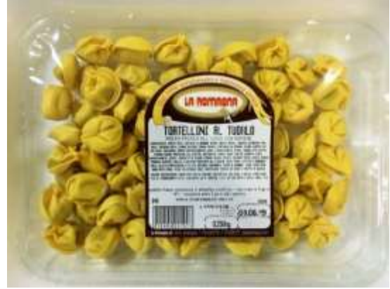
LR345 - TORTELLINI CARNE AL TUORLO GR 250 X 12