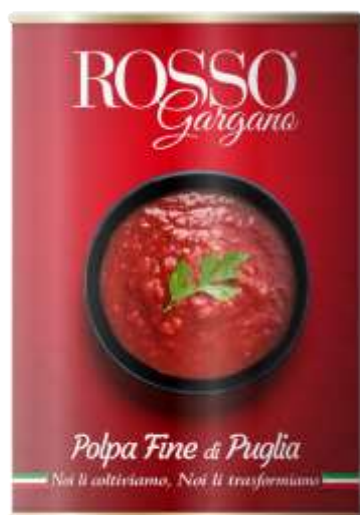
RG08 - POLPA FINE GR 400 X 12 EASY OPEN