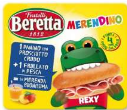
SB818 - MERENDINO BERETTA PANINO AL CRUDO GR 40 + FRULLATO PESCA ML 125