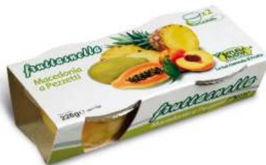
NN132 - FRUTTASNELLA GR 113X2 (X6) MACEDONIA A PEZZETTI