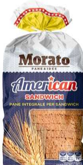
W0519 - INTEGRALE GR600 X 9