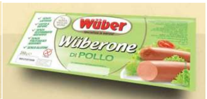
SB24 - WUBERONE POLLO GR250