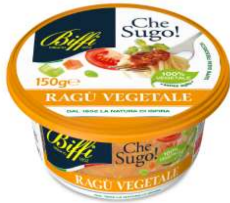
T0014 - RAGU' VEGETALE GR 150 EAN 80073116