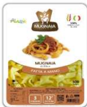
PM01 - MUGNAIA DI ELICE GR 500 X 10