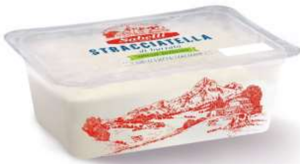
L7220/ - STRACCIATELLA S/LATTOSIO GR 250 X 5 T.A.