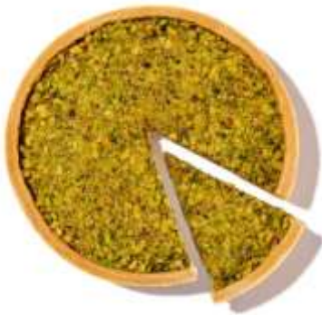
AM03 - TORTA AL PISTACCHIO GR 230