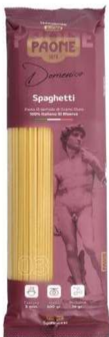
PP403 - SPAGHETTI GR 500 X 20

Qualità Premium, questa linea di Pasta trasmette i 140 anni di esperienza di Paone e il legame viscerale con la cultura italiana.