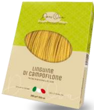
DO22 - LINGUINE DI CAMPOFILONE GR 250