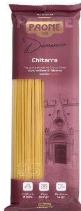
PP405 - CHITARRA GR 500 X 20