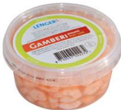
R2112 - GAMBERETTI GR 125 R1318 - GAMBERETTI GR 900