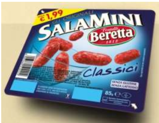
SB149 - SALAMINI CLASSICI