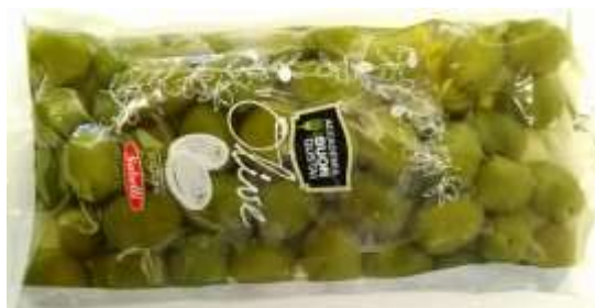
B828 - OLIVE VERDI DOLCI GR 400