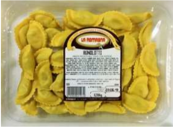
LR333 - AGNOLOTTI DI CARNE GR 250 X 12