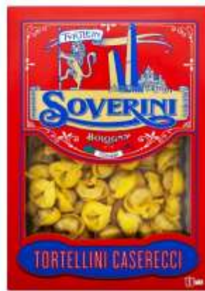
TS20 - TORTELLINI CASERECCI GR 250 EAN 8027547000203