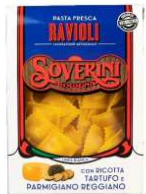
TS44 - RAVIOLI RIC. TARTUFO BIANCO E PARM. REGG. GR 250 EAN 8027547000449