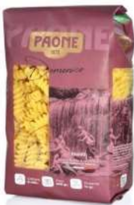
PP423 - FUSILLI GR 500 X 20