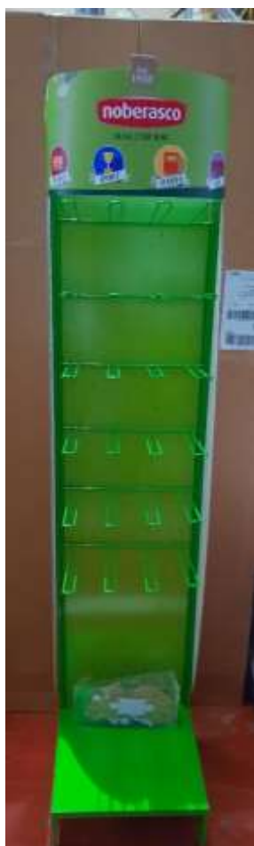
NB7058 - EXPO 24 CT TERRA