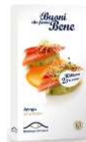
R4104 - FILETTI DI ARINGHE GR 200