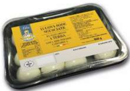
EU9090 - UOVO SODO ALL. TERRA X 15 (4 PZ X CT) EU5151 - UOVO SODO CAL. DIVERSO SECCHIELLO X 60