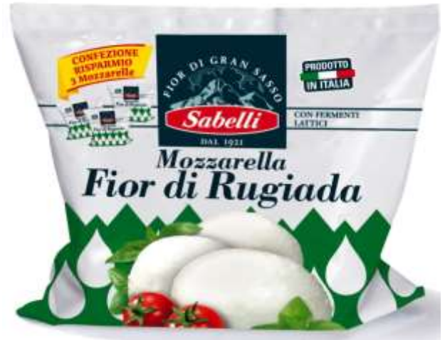
L401 - MOZZARELLA TRIS GR 100X3 x 8 PZ