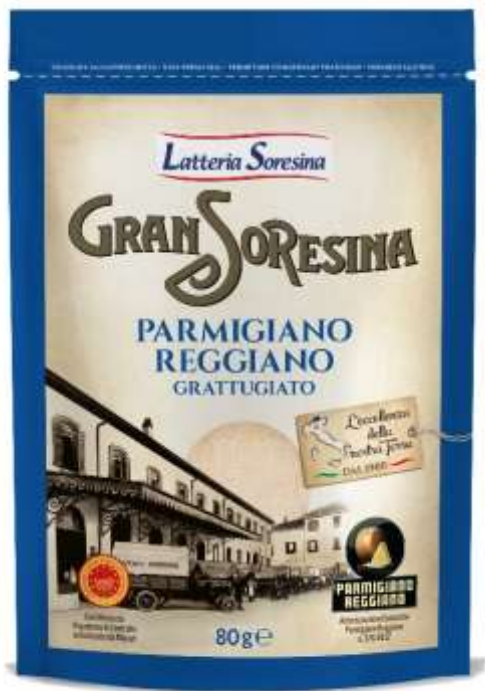
S3532 - PARMIGIANO REGGIANO GR 80 x 16 pz