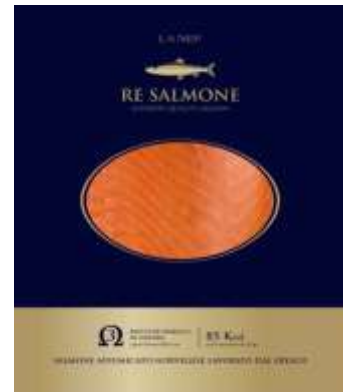
R2140 - RE SALMONE GR 50 R5242 - RE SALMONE GR 100 R5144 - RE SALMONE GR 200