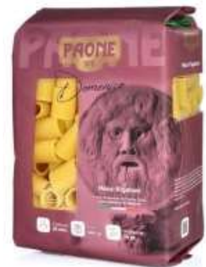
PP422 - MEZZI RIGATONI GR 500 X 20