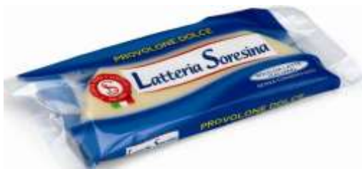
S3118 - DOLCE GR 250