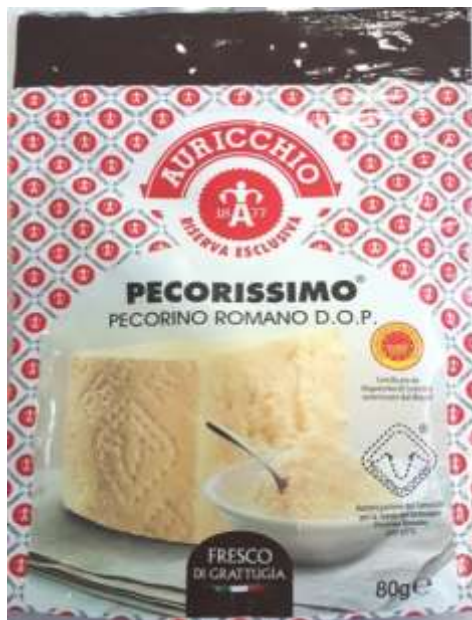
AG71 - PECORISSIMO GRATT. GR 80 X 15