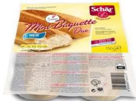
DS008 - MINIBAGUETTE GR 150 X 7