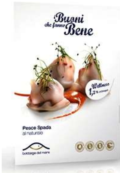
R9542 - FETTE DI SPADA AL NATURALE GR 80