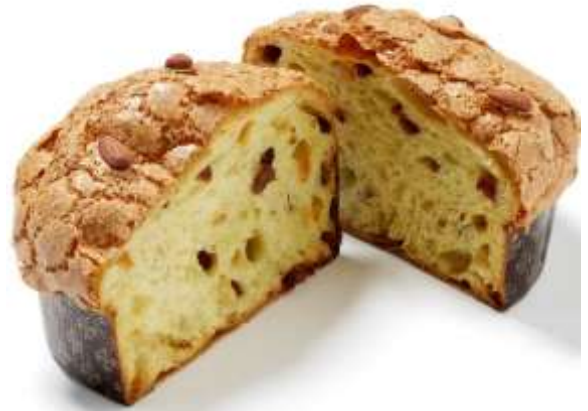
AM01 - PANE - VEGAN CLASSICO GR 550 CON UVETTA E ARANCIA