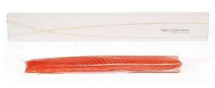
R2502 - FILETTO DI CODA NERA GR 340