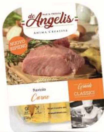
DA0331 - RAVIOLO DI CARNE GR250 (8PZ) EAN8021228410206