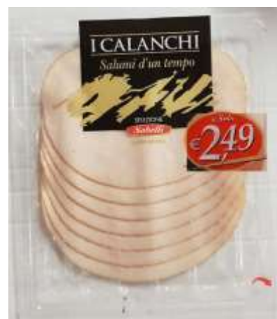
G707A - TACCHINO GR 110