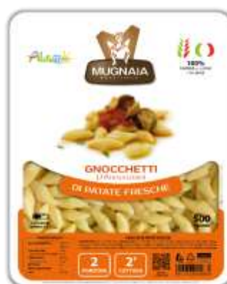
PM04 - GNOCCHETTI D'ANNUNZIANI GR 500X10