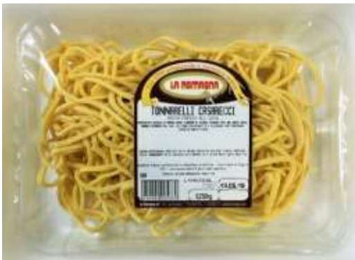
LR723 - TAGLIATELLE CASARECCE GR 250 X 12