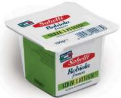
L259 - ROBIOLA S/LATTOSIO GR 100 X 8