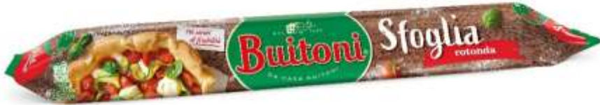
NF122 - GR 230