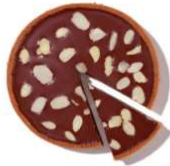
AM04 - TORTA GIANDUIA E COCCO GR 230