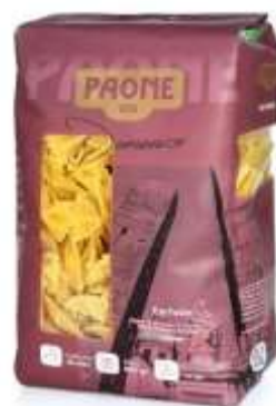
PP424 - FARFALLE GR 500 X 20