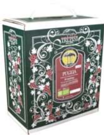
AM06 - BAG IN BOX PRIMITIVO DI PUGLIA BIO 3 LT VEGAN