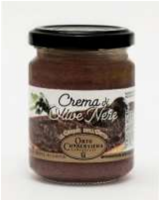
OR06 - CREMA DI OLIVE NERE GR 130X12

L'Orto Conserviera Cameranesse è una azienda agroalimentare che produce, conserva e commercializza prodotti sott'olio da ormai tre generazioni. Con passione ed esperienza, preserva e tramanda ricette e sapori legati al territorio marchigiano e alle sue tradizioni.