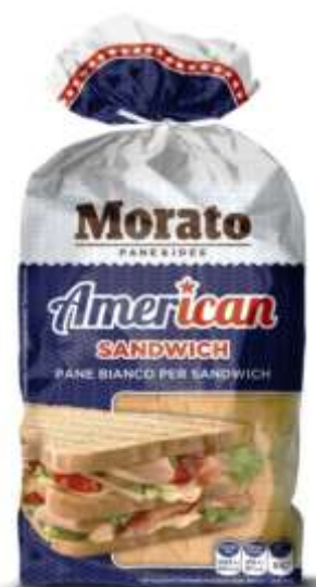
W0517 - CLASS. GR 550 X 9