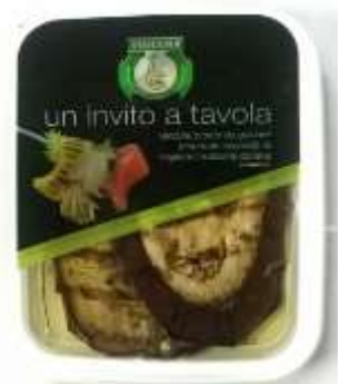
B202 - MELANZANE ARROSTITI GR 200