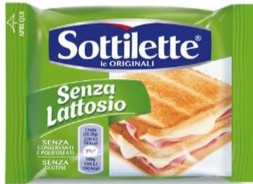
K099 - SOTTILETTE S/LATTOSIO GR 200