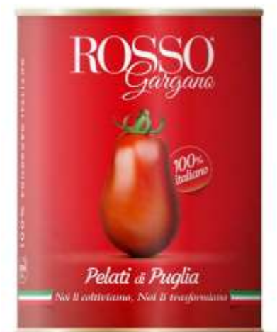
RG07 - PELATO GR 800 X 12 EASY OPEN