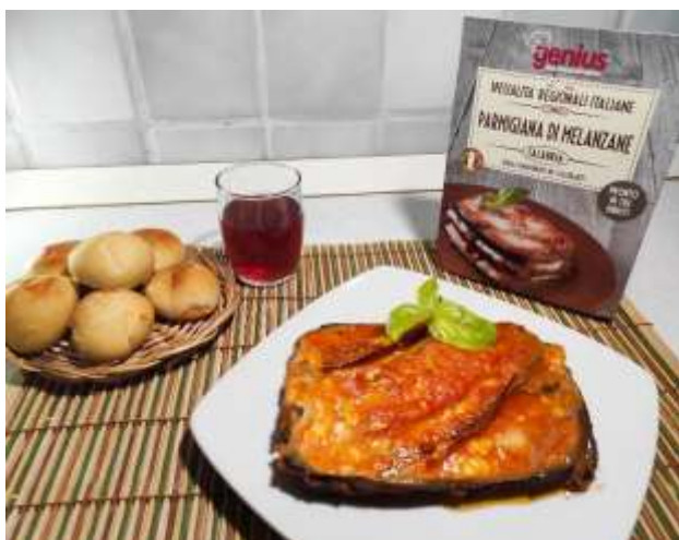
GE304 - PARMIGIANA DI MELANZANE GR 300 EAN 8033726523074