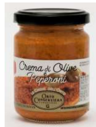
OR11 - CREMA DI OLIVE/PEPERONI GR 130X12