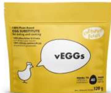
ES2049 -SOSTITUTIVO VEGAN ALL'UOVO GR 128