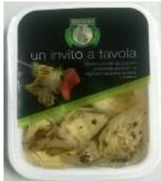
B201 - CARCIOFI GRIGLIATI GR 200