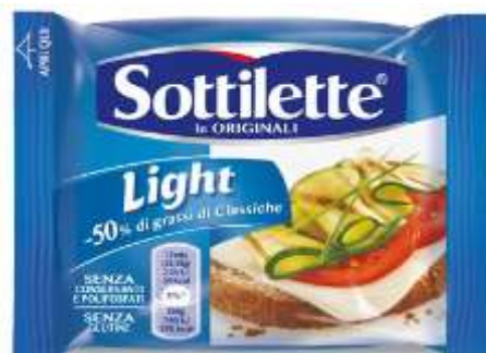
K055 - SOTTILETTE LIGHT 200