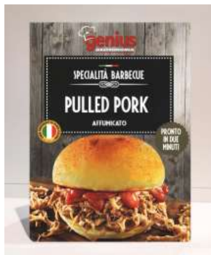
GE333 - PULLED PORK GR 400 EAN 8033726523333