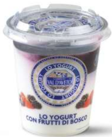
VA274 - FRUTTI DI BOSCO