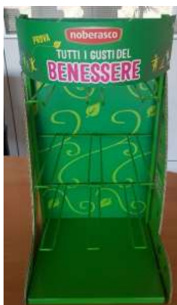
NB7026 - EXPO 9 CT TAVOLO