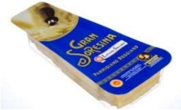
S2630 - PARMIGIANO GR 300