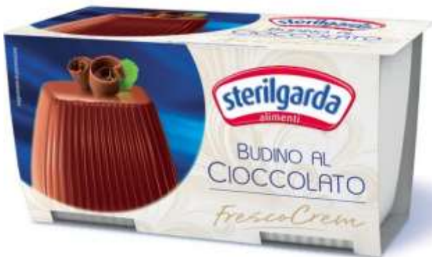
ST23 - BUDINO AL CIOCCOLATO 100 GR X 2