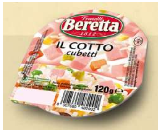
SB68 - CUB. COTTO GR 120