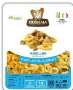
PM09 - ANELLINI ALLA PECORARA GR 500X10