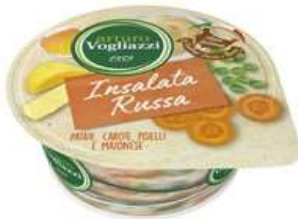
PF096 - INSALATA RUSSA VOGLIAZZI GR 150