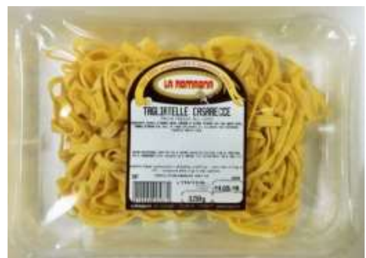
LR728 - TONNARELLI CASARECCI GR 250 X 12