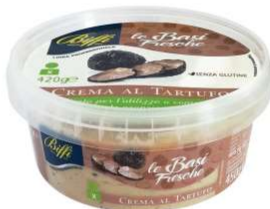
T0042 - CREMA AL TARTUFO GR 450