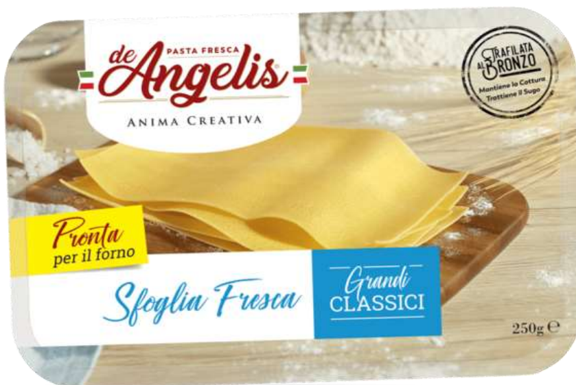
DA0263 - SFOGLIA PER LASAGNE ALL'UOVO GR 250 (10 PZ) EAN 8021228310056