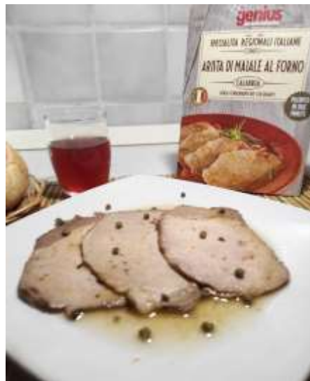
GE234 - ARISTA DI MAIALE AL FORNO GR 250 EAN 8033726523034