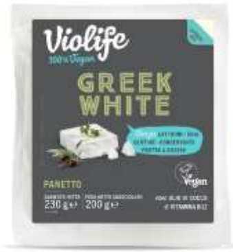
ES2024 - ALTERNATIVA VEGANA FETA GR 200 GREEN WHITE