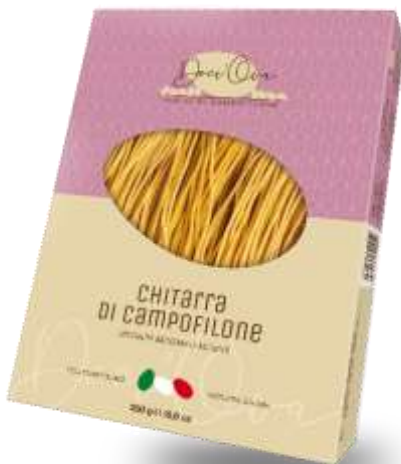
DO25 - PASTA ALLA CHITARRA GR 250 DO245 - PASTA ALLA CHITARRA KG 1 DO246 - FILI DI CHITARRA KG 1