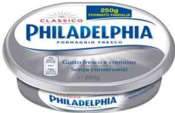
K953 - PHILADELPHIA GR 250