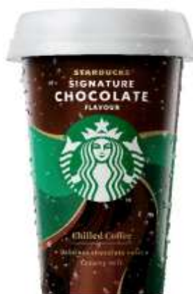
ES8176 - CIOCCOLATO ML 200 (10 PZ)