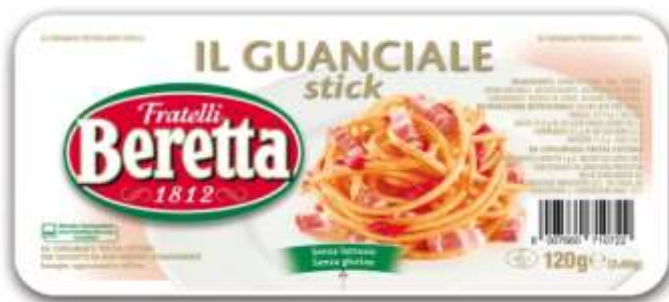
SB131 - GUANCIALE STICK GR 120