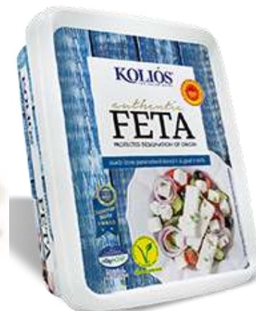
KL220 - FETA DOP CUBETTI GR 150