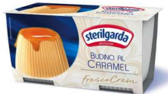
ST25 - BUDINO AL CAMEL 100 GR X 2