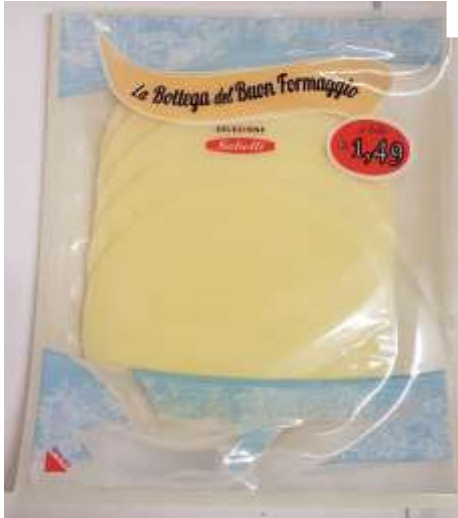
G752A - SCAMORZA BIANCA ATP GR 70X6