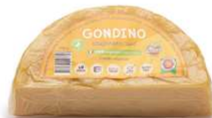
AM10 - GONDINO STAGIONATO SPICCHIO GR 200