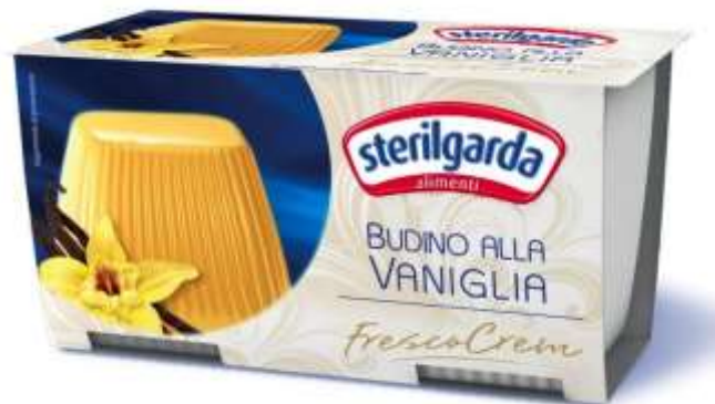
ST24 - BUDINO ALLA VANIGLIA 100 GR X 2