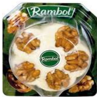
Q4323 - RAMBOL GR 125 X 6