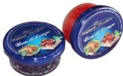
R052 - UOVA CAPELIN 100 GR NERO R053 - UOVA CAPELIN GR 100 ROSSO R060 - UOVA LOMPO GR 50 NERO R061 - UOVA LOMPO GR 50 ROSSO