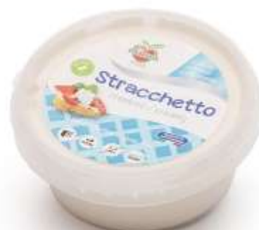
AM08 - STRACCHETTO VEGAN FORMAGGIO SPALMMABILE GR 170