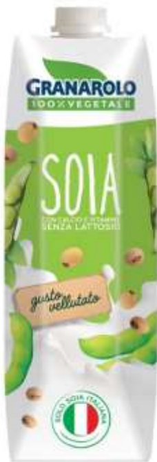
X50185 - BEVANDA DI SOIA 1 LT X 6