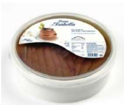
R5115 - FIL. ACCIUGHE CANTABRICO GR 360