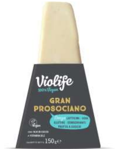
ES2030 - GRAN PROSCIOCIANO SPICCHI VEGAN GR 150