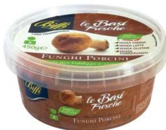
T0041 - SUGO AI FUNGHI PORCINI GR 450