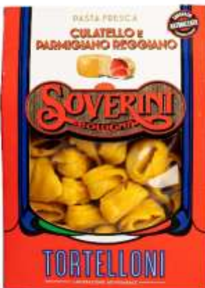
TS16 - TORTELLONI CULATELLO E PARMIGIANO GR 250 EAN 8027547000166