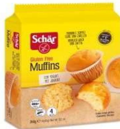
DS221 - MUFFINS GR 260 X 4