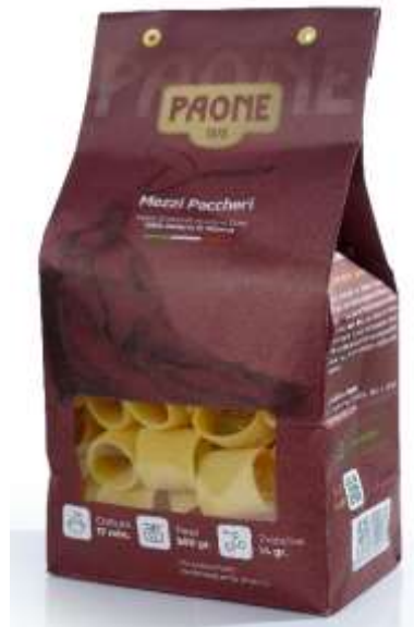
PP431 - MEZZI PACCHERI GR 500 X 12