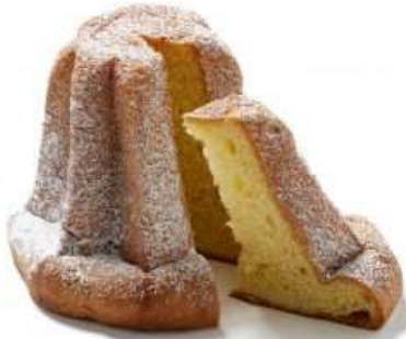
AM02 - VEG'ORO BIO VEGAN GR 550