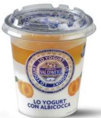
VA271 - ALBICOCCA