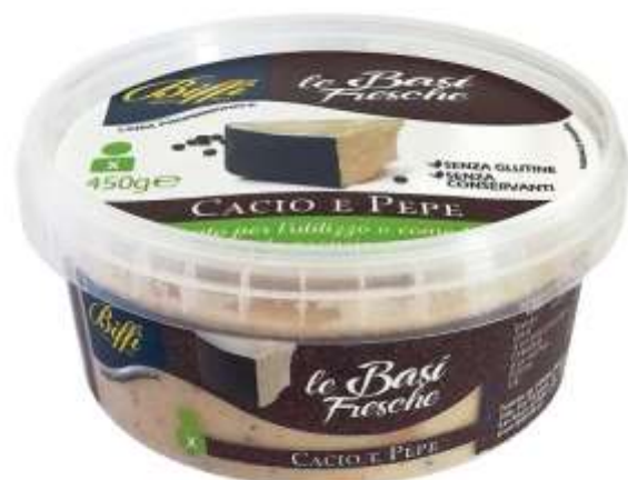
T0039 - SUGO CACIO E PEEP GR 450