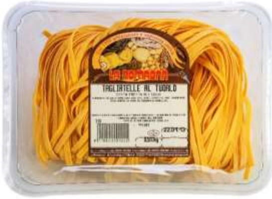
LR310 - TAGLIATELLE AL TUORLO GR 500 X 6