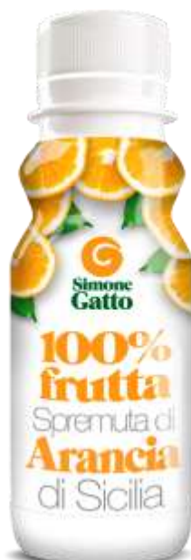
SG07 - SUCCO DI ARANCIA BIONDO ML 200 X 8 EAN 8006116121266