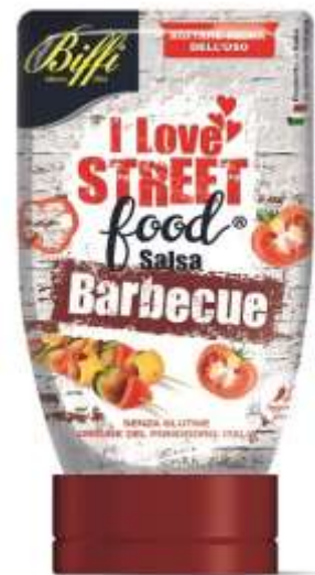
T0085 - SALSA BBQ GR 270 X 6