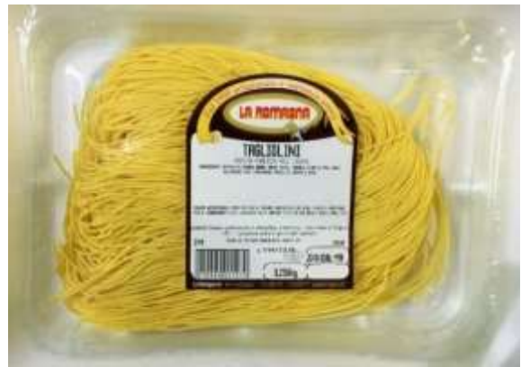
LR314 - TAGLIOLINI AL TUORLO GR 250 X 12