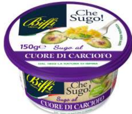
T0020 - CUORE DI CARCIOFO GR 150 EAN 80073123