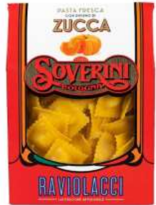
TS12 - RAVIOLACCI CON ZUCCA GR 250 EAN 8027547000128