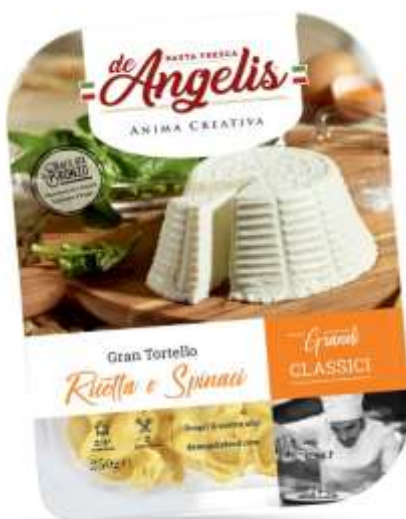
DA0305 - GRAN TORTELLO RICOTTA E SPINACI GR 250 ( 8 EAN 8021228410015