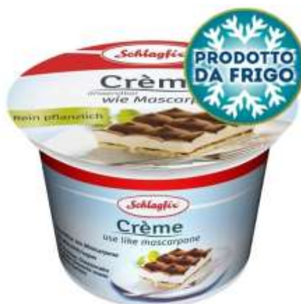
AM11 - CREMA PER TIRAMISU' VEGAN GR 250