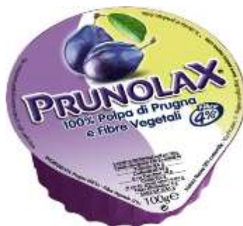
NN021 - PRUNOLAX VASCH. 100 GR X 18