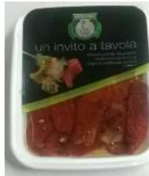
B204 - POMODORI SECCHI GR 200