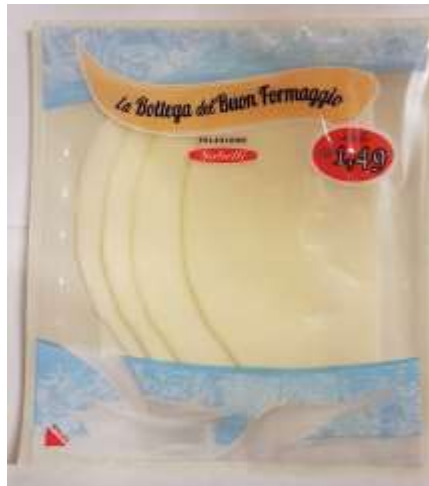
G754A - PROVOLONE VALPADANA ATP GR 60X6