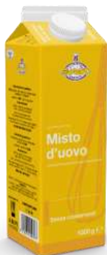
EU5091 - PREPARATO UOVA STRAPAZZATE BOTT. KG 1 X 6 EU5197 - ALBUME FRESCO BRIK KG 1 X 6 EU4829 - TUORLO D'UOVO FRESCO KG X 6 EU5275 - TUORLO D'UOVO FRESCO SPECIALE K EU4432 - MISTO UOVO FRESCO KG 1 X6