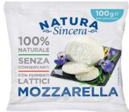
LA414 - MOZZARELLA GR 100 X 15 PZ