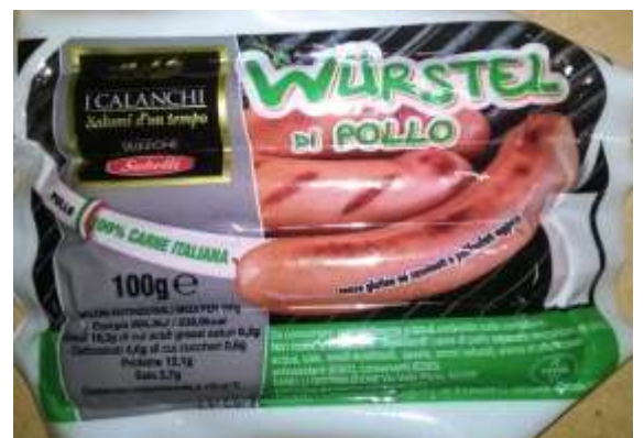
G638 - WURSTEL POLLO I CALANCHI GR 250 X 18