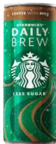
ES8187 - CAFFELATTE LATTINA ML 250 (12 PZ)