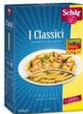
DS402 - FUSILLI GR 500 X 6 DS405 - PENNE RIGATE GR 500 X 6 DS411 - DITALI GR 500 X 6 DS412 - RIGATONI GR 500 X 6 DS406 - TAGLIATELLE GR 250 X 6