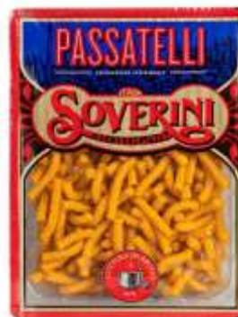
TS67 - PASSATELLI GR 250 EAN 8027547300679