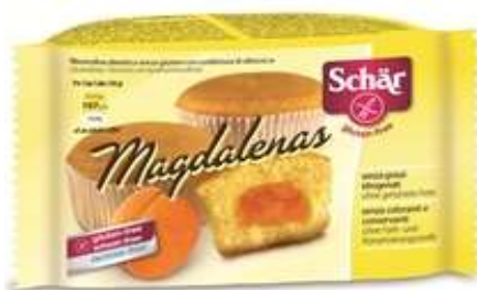
DS512 - MAGDALENAS GR 50 X 20