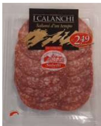
G706A - SALAME MILANO GR 110