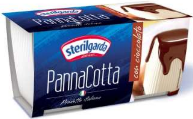
ST21 - PANNA COTTA CIOCCOLATO 90 GR X 2