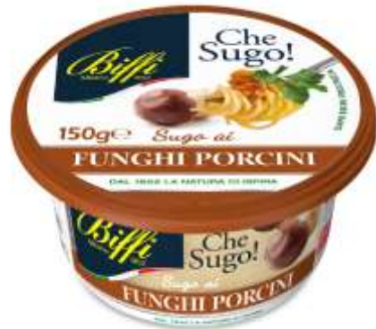
T0021 - SUGO AI FUNGHI PORCINI GR 150 EAN 80073130