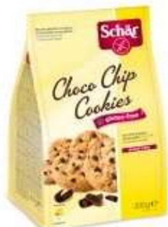
DS343 - CHOCO CHIP COOKIES X 12