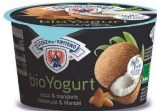
U5819 - YOGURT BIO INTERO COCO E MANDORLE GR 250 X 6

LE MUCCHE CHE PRODUCONO LATTE FIENO NON SONO ALIMENTATE DA FORAGGI FERMENTATI NE' CON MANGIMI OGM