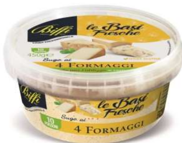
T0046 - SUGO AI 4 FORMAGGI GR 450