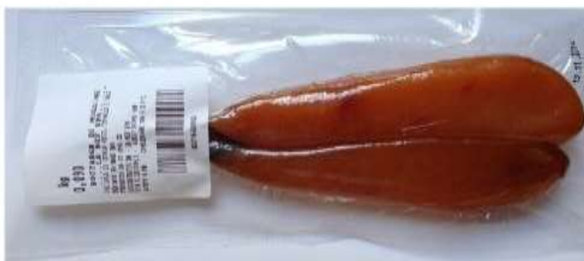
R7200 - BOTTARGA DI MUGGINE S.V. GR 70/100