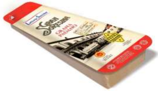
S3409 - GRANA PADANO GR 300