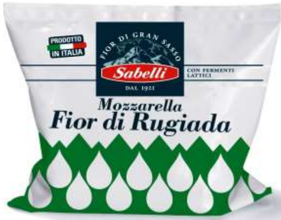
L400 - MOZZARELLA GR 100 x 15 PZ