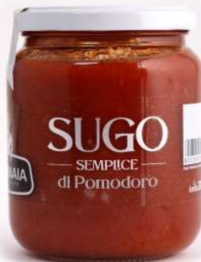
PM29 - SUGO DI POMODORO GR 370 X 12