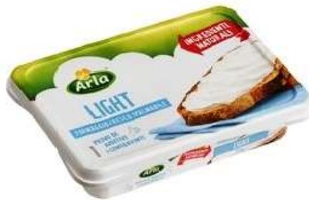
AF592 - LIGHT GR 150 X 10