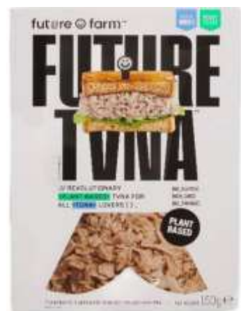
AM05 - ALTERNATIVA AL TONNO VEGAN GR 150