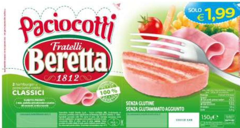
SB155 - PACIOCOTTI CLASSICI FLASH 1,99 GR 150