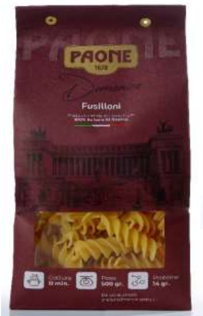
PP433 - FUSILLONI GR 500 X 12