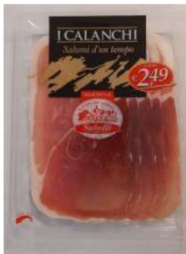
G701A - CRUDO GR 80