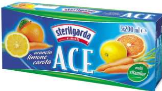
ST 11 - SUCCO ACE ML 200 X 3