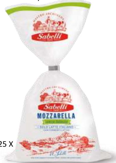
L278/S278 - MOZZARELLA S/LATTOSIO GR 200 X 6