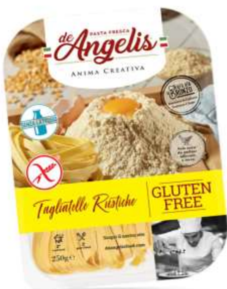
DA1140 - TAGLIATELLE ALL'UOVO GR 250 X 6 € 2,95/PZ EAN 8021228901339