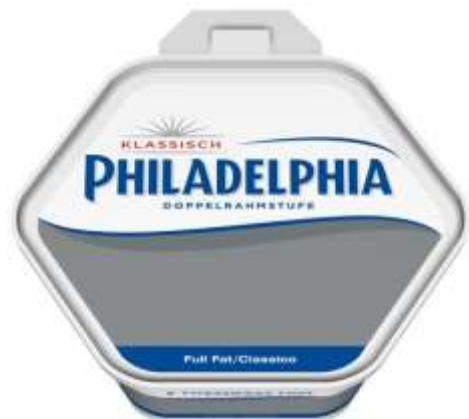
K9681 - PHILADELPHIA KG 1,65