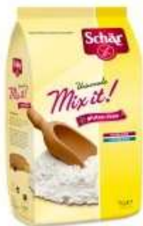
DS602 - MIX IT GR 1000 X 10