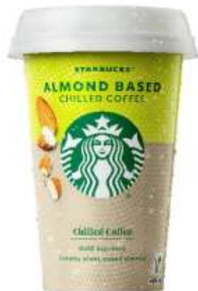
ES8172 - CAFFE' E LATTE DI MANDORLA ML 220 (10 PZ)