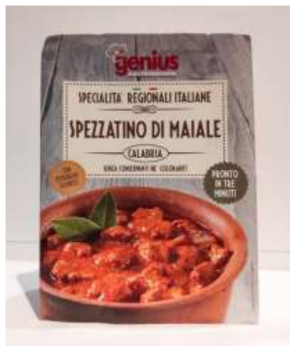
GE302 - SPEZZATINO DI MAIALE GR 500 EAN 8033726523029