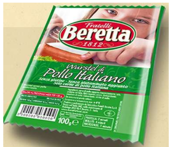
SB26 - WURSTEL POLLO GR 100