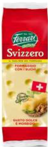
Q425 - SVIZZERO GR 300 X 16