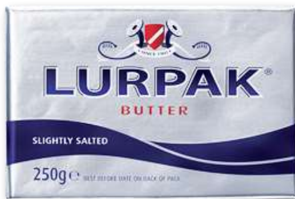
AF033 - BURRO LURPAK LEG. SALATO GR 250