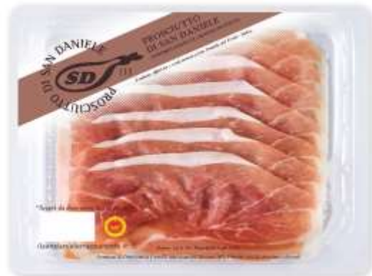
SB0818 - PROSCIUTTO SAN DANIELE D.O.P. 16 GR 90 X 8