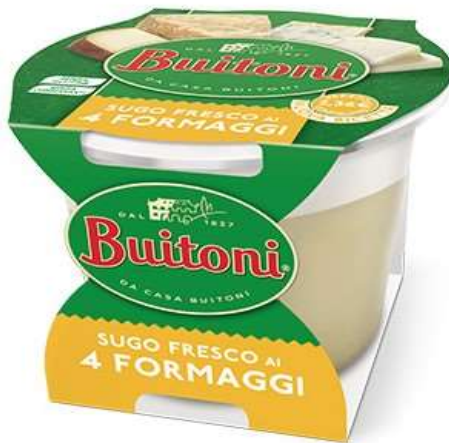
NF143 - SUGO FRESCO AI 4 FORMAGGI GR 160