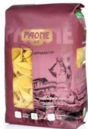
PP427 - CONCHIGLIE DI MARE GR 500 X 20