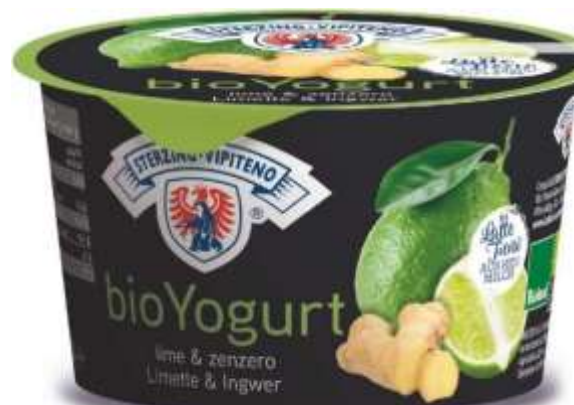
U5835 - YOGURT BIO INTERO LIME E ZENZERO GR 250 X 6