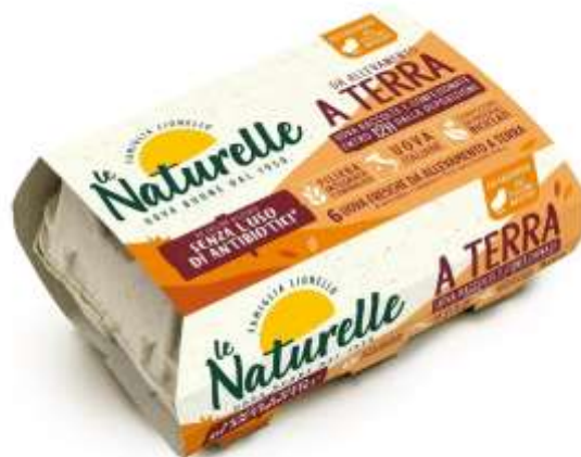
EU1377 - NATURELLE ALL. TERRA X 6 CALIBRO DIVERSO ( 24 PZ X CT)