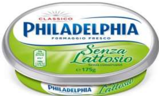
k909 - PHILADELPHIA S/LATTOSIO GR 175