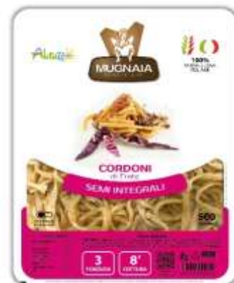
PM05 - CORDONI DI FRATE GR 500 X 10