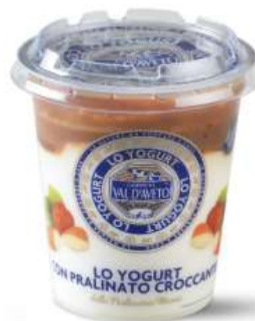
VA358 - PRALINATO CROCCANTE