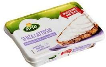
AF775 - SENZA LATTOSIO GR 150 X 10