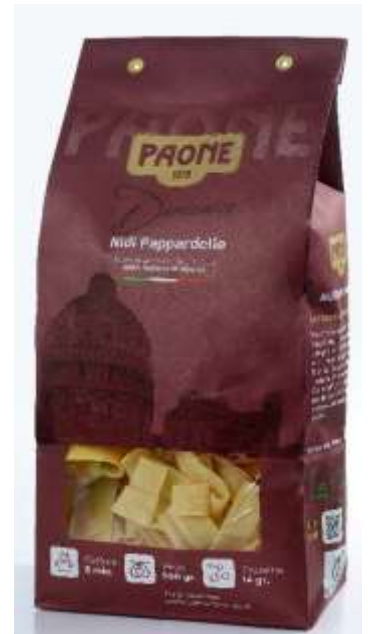
PP438 - NIDI PAPPARDELLE GR 500 X 12