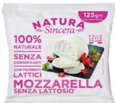
LA412 - MOZZARELLA SENZA LATTOSIO GR 125 X 8 PZ