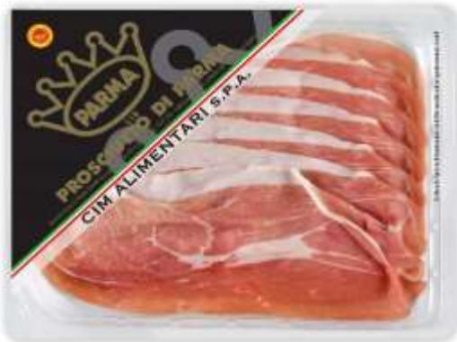
SB861 - PROSCIUTTO DI PARMA D.O.P. 18 M GR 90 X 8