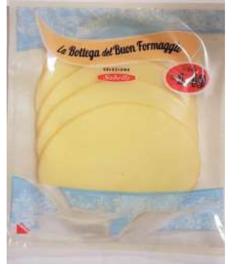
G753A - SCAMORZA AFF. GR 70X6