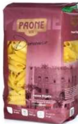
PP415 - PENNE RIGATE GR 500 X 12