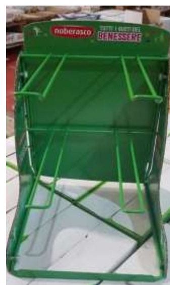
NB7052 - EXPO 4 CT TAVOLO