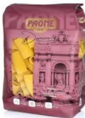
PP421 - RIGATONI GR 500 X 20