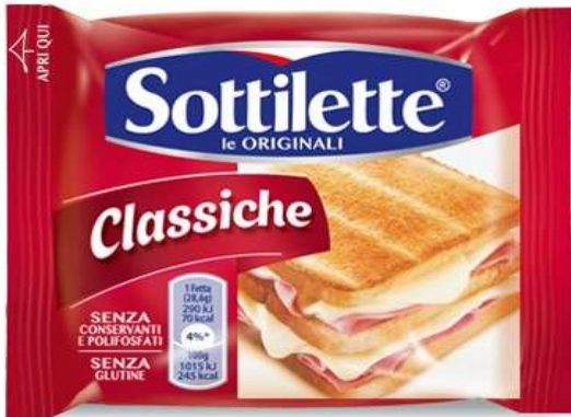
k049 - SOTTILETTE GR200