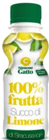
SG01 - SUCCO DI LIMONE IGP DI SIRACUSA ML 100 X 10 CON DOSATORE A GOCCIA EAN 8006116125110