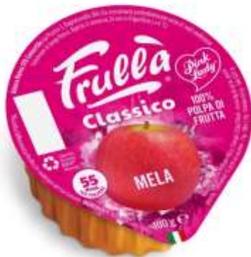
VASCHE TTE GR 100 X 18