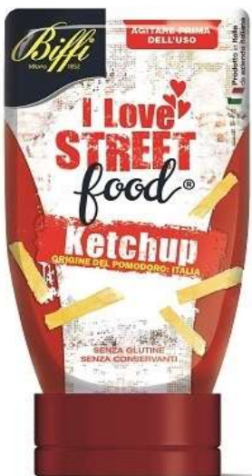
T0011 - KETCHUP GR 280 X 12