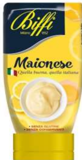
T0031 - MAIONESE GR 247 X 12