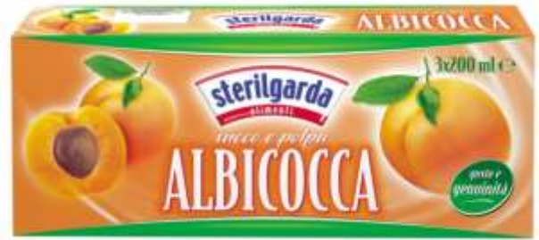
ST 10 - SUCCO ALBICOCCA ML 200 X 3