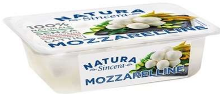
LA424 - MOZZARELLINE GR 150 (10 PZ)