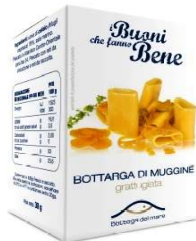
R7481 - BOTTARGA DI MUGGINE GRATT. VASO GR 30