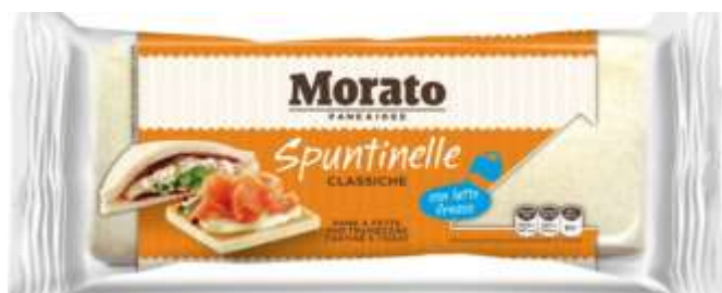
W0001 - SPUNTINELLA GR 250 X 12