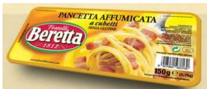
SB29 - CUBETTI DOLCE GR 150