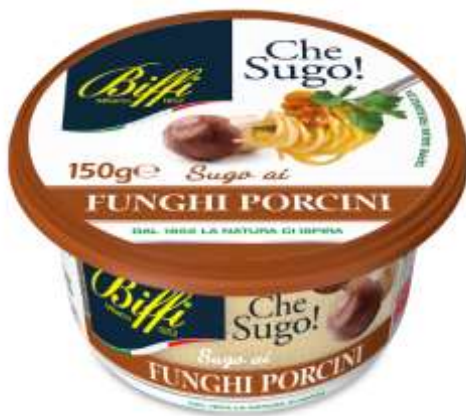
T0021 - SUGO AI FUNGHI PORCINI GR 150 EAN 80073130