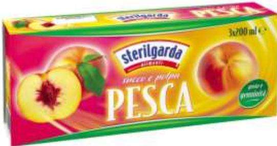
ST09 - SUCCO PESCA ML 200 X 3