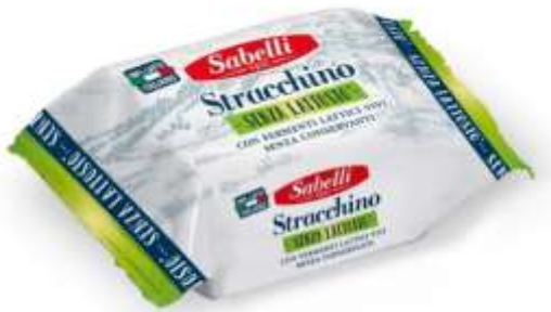
L253 - STRACCHINO S/LATTOSIO GR 100 X 8