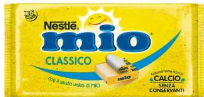
NF147 - FORMAGGINI MIO GR 125