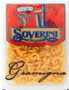
TS61 - GRAMIGNA ALL'UOVO GR 250 EAN 8027547100613