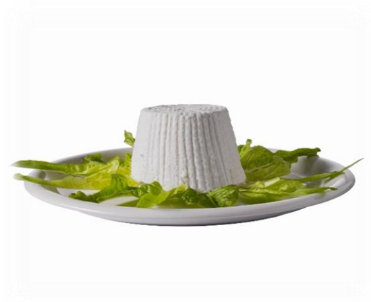
RICOTTINA DI BUFALA 100 GR E100