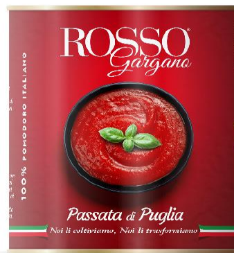
PASSATA 2,5 KG RG10