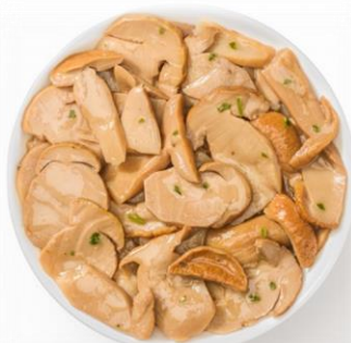
FUNGHI PORCINI TRIFOLATI 800 GR SOTT'OLIO E IN CREMA Z138/Z138P