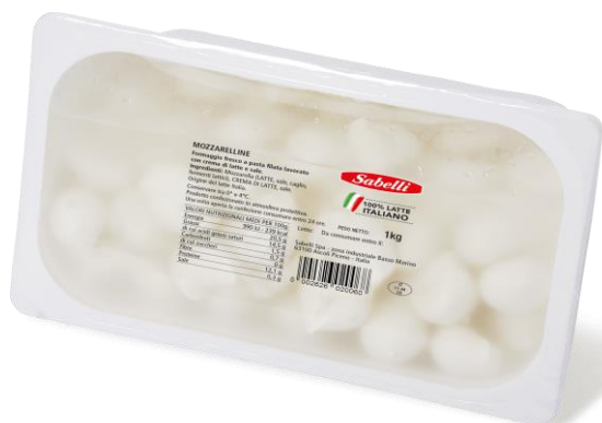
MOZZARELLINA 16 GR x 1 KG L001