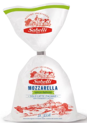
MOZZARELLA SENZA LATTOSIO 200 GR L278