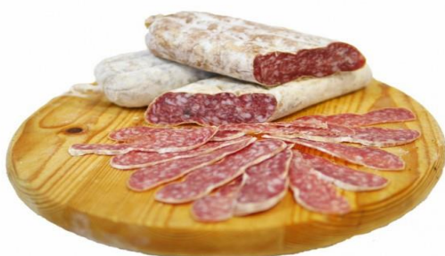
SALAME AQUILANO 9290