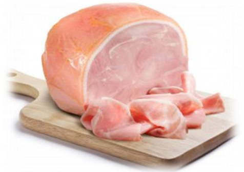
SPALLA COTTA SGR E TOAST 9207/9208/9210