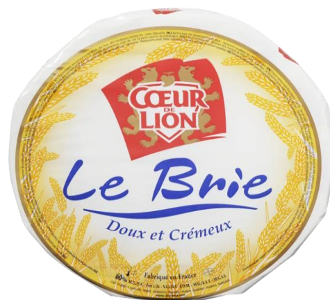
BRIE 1KG Q7820