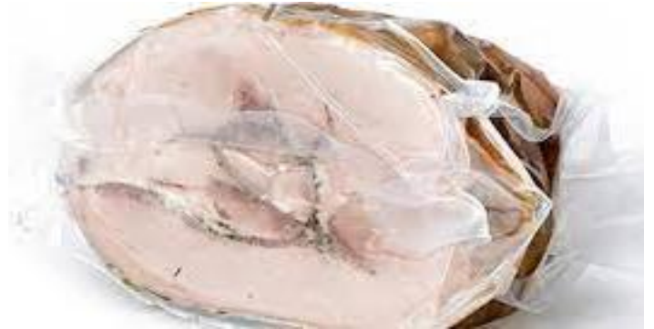
PORCHETTA D'ARICCIA SOTTO VUOTO 5 KG RL2082