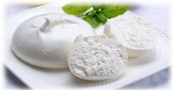
BURRATINA SENZA TESTA 100GR L823/L725