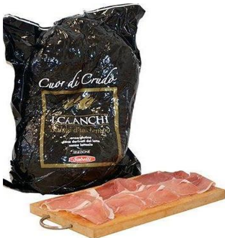
CUOR DI CRUDO G022