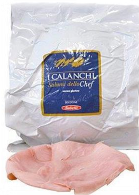
COTTO CHEF INTERO E A META' G219/G220