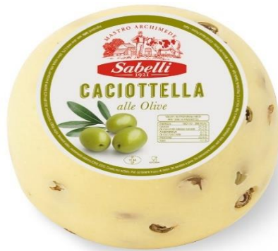
CACIOT. VACCINA ALLE OLIVE LH213