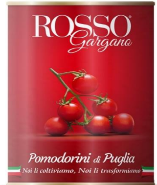
POMODORINO KG3 IN LATTA RG02