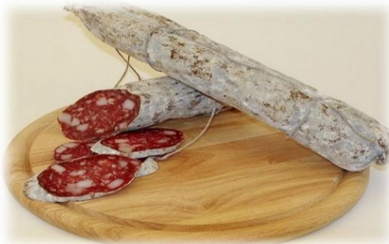
CORALLINA NAZIONALE G385