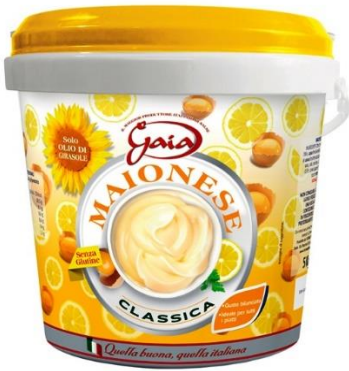
MAIONESE 5 KG V414