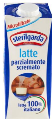
LATTE UHT INTERO O P.S. MICROFILTRATO ST01 \ ST02