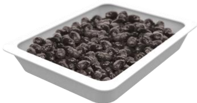
OLIVE NERE AL FORNO B822