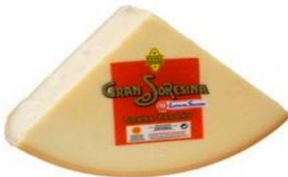
GRANA PADANO 1/8 Q263