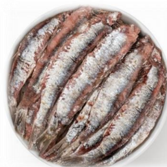
ALICI SALATE 5 KG SD671