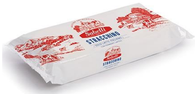
STRACCHINO SABELLI 1 KG L46