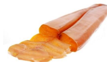
BOTTARGA DI MUGGINE 70GR R7200