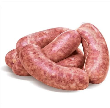
SALSICCIA FRESCA MACINATA ED A COLTELLO RL4001/RL4002