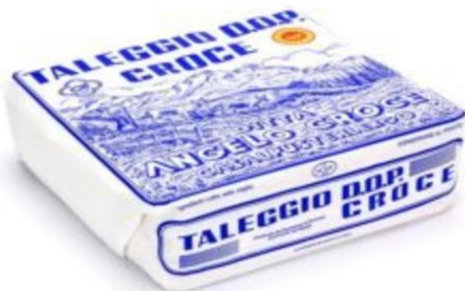
TALEGGIO CROCE Z6