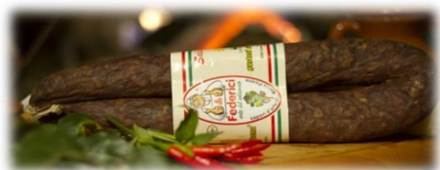
SALAMELLA DI FEGATO G178