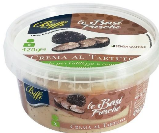
CREMA AL TARTUFO GR 450 T0042