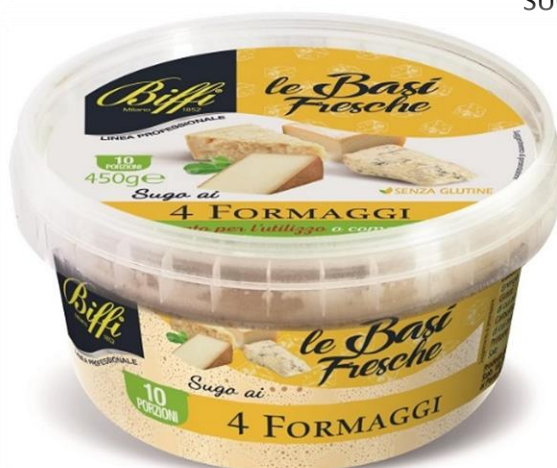
SUGO AI 4 FORMAGGI GR 450 T0046