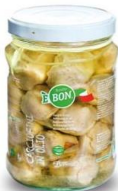
CARCIOFI SOTT'OLIO 50/60 INTERI 1,7 KG Z017