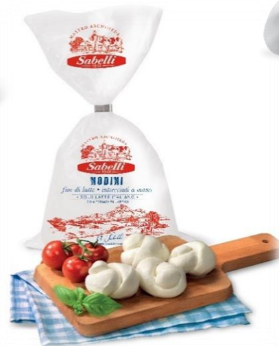
NODINO LEGATO A MANO GR 250 L360