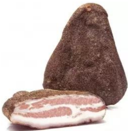
GUANCIALE AL PEPE NERO E AL PEPERONCINO LEONI RL5004/RL5005