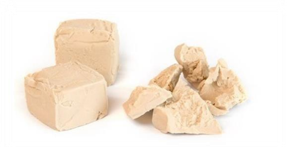
LIEVITO 0,5 KG V35