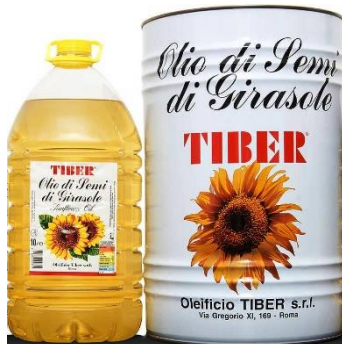
OLIO DI SEMI DI GIRASOLE ED ALTOLEICO V130/1732