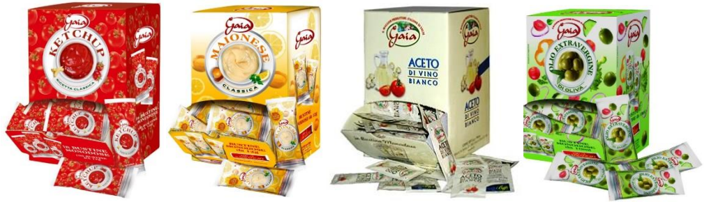
MONODOSE MAIONESE KETCHUP ACETO OLIO SALE ACETO BALSAMICO T5800/T5810/T5814/T5815/T9041