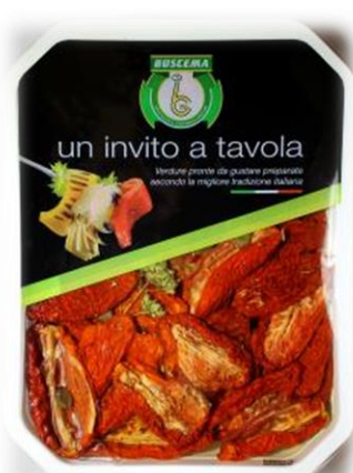
POMODORI SECCHI B151