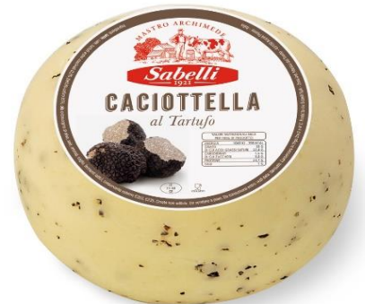
CACIOT. VACCINA AL TARTUFO LH211