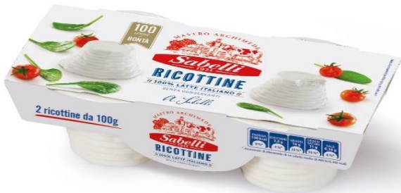
RICOTTINA DI MUCCA 100 GR X 2 L396