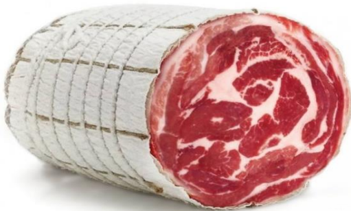
PANCETTA SUPERCOPPATA PM1113