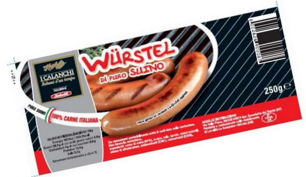
WURSTEL DI SUINO 100 GR x 4 / 250 GR x3 G635/G636