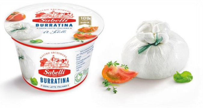
BURRATINA CON TESTA 125 GR L322\L722