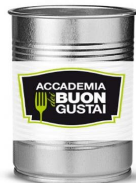
OLIVE DENOCCIOLATE NERE VEREDI E A RONDELLE B826/B827/B833