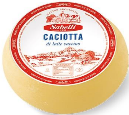
CACIOTTA VACCINA LH007