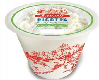
RICOTTINA SENZA LATTOSIO 300 GR L294