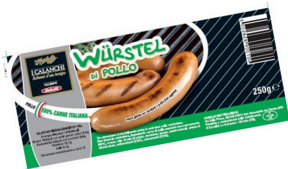
WURSTEL DI POLLO 100 GR x 4 / 250 GR x 3 G637/G638