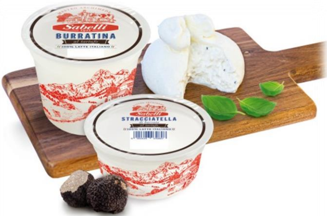
BURRATINA AL TARTUFO 100 GR L9725 STRACCIATELLA AL TARTUFO 140 GR L9723