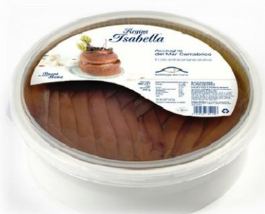
FILETTI DI ALICI DEL CANTABRICO 360 GR E 50 GR R5115/R5100