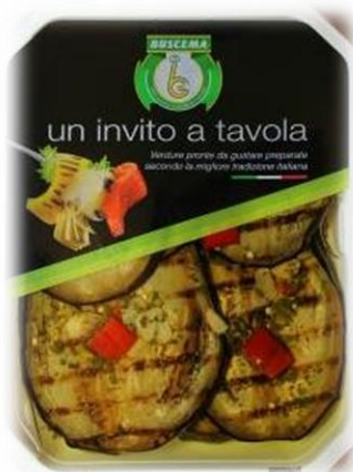
MELANZANE GRIGLIATE 1,8 KG E 1 KG B1445/B140