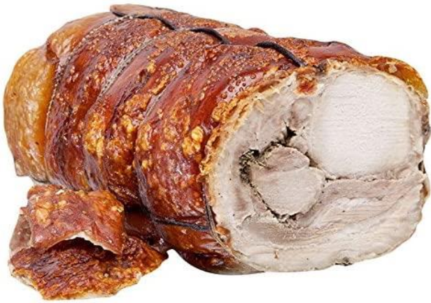
PORCHETTA D'ARICCIA 5 KG/ 10 KG / 40 KG RL1001/RL1002/RL2001/RL2002/