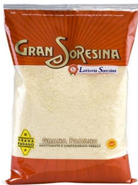
GRANA PADANO GRATTUGIATO 1 KG S3712