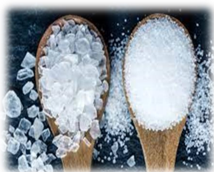
SALE MARINO GROSSO E FINO V42/43/V46/V47