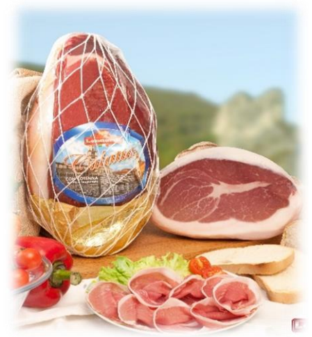
CULATTA NAZIONALE E ESTERA PL01/PL02