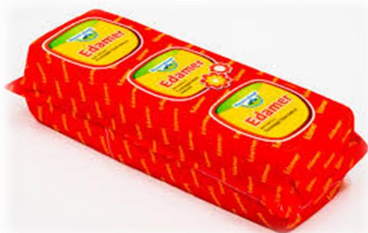
EDAMER 2,5 KG 0147/X6309