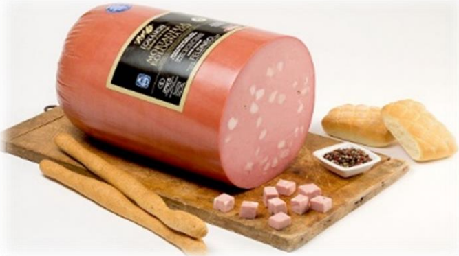
MORTADELLA BOLOGNA IGP CON E SENZA PISTACCHIO FE039/FE059