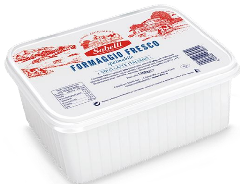
FORMAGGIO FRESCO SPALMABILE 1,375 KG L56