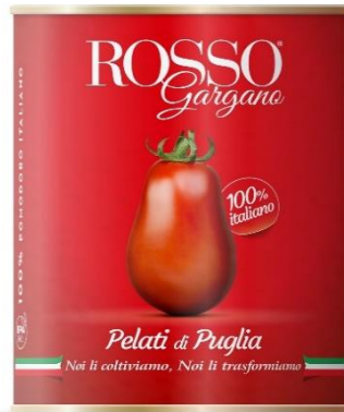
PELATO KG3 IN LATTA RG01