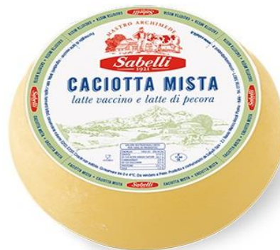
CACIOTTA MISTA LH008