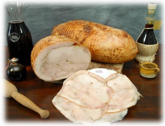
TACCHINO PORCHETTATO OG950