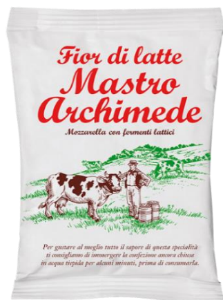
FIOR DI LATTE MASTRO ARCHIMEDE GR.375/300/200 L379/L381/L380