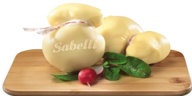
SCAMORZA BIANCA E AFFUMICATA 250 GR L21\L28