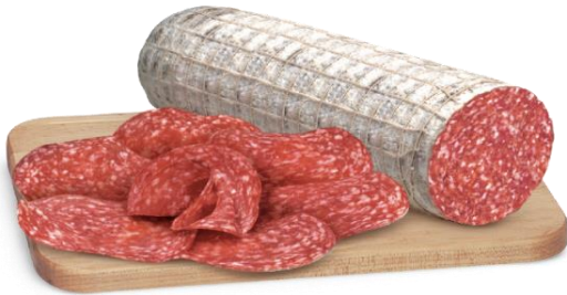
SALAME MILANO E UNGHERESE G363/G373