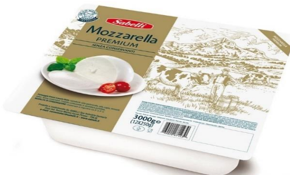
MOZZARELLA PREMIUM PIZZA IN ACQUA 3KG L494