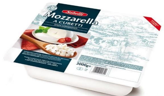
CUBETTATA SABELLI 3KG L477