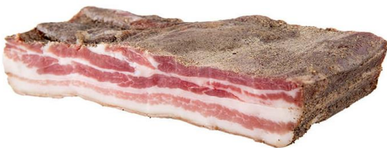
PANCETTA TESA DOLCE E AFFUMICATA G025/G026