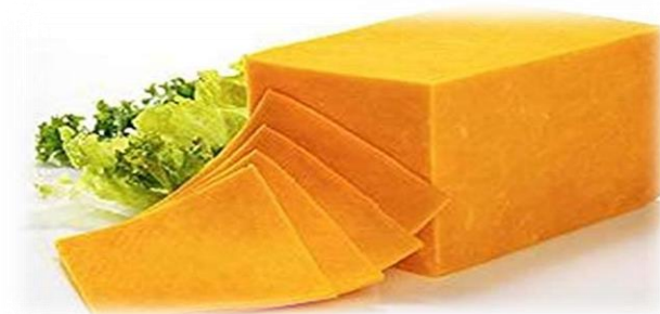
CHEDDAR 2,5 KG 0196