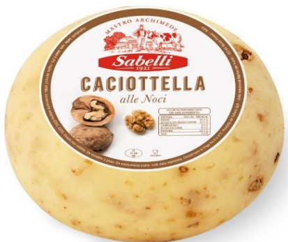
CACIOT. VACCINA ALLE NOCI LH210