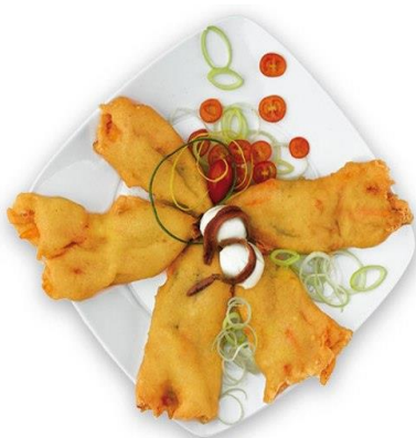
FIORI DI ZUCCA 700 GR AS262