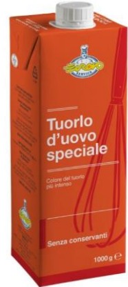
TUORLO D'UOVO 1 LT NORMALE E SPECIALE EU4829/EU5275