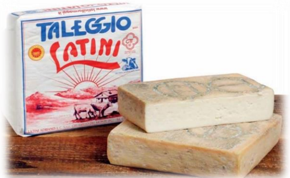
TALEGGIO LATINO INTERO E A META' LT12/LT212