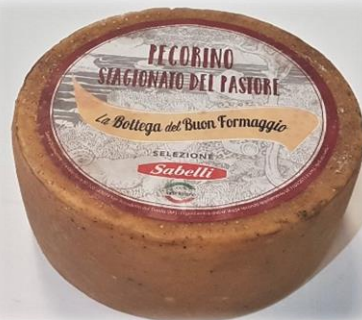
PECORINO DEL PASTORE LQ02