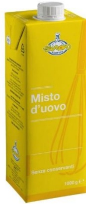
MISTO D'UOVO 1 LT NORMALE E SPECIALE EU4432/EU5274