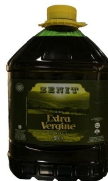
OLIO EXTRA VERGINE D'OLIVA 5 LT V102