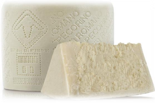
PECORINO ROMANO X80072