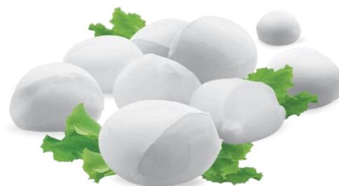
CILIEGINA 8 GR x 1 KG L0001