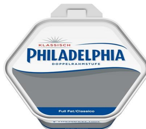
PHILADELPHIA 1,650 KG K9681