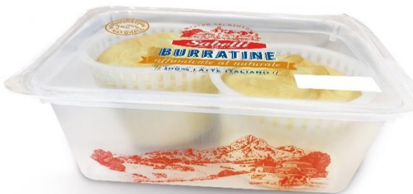
BURRATINA AFFUMICATA 100 GR L727