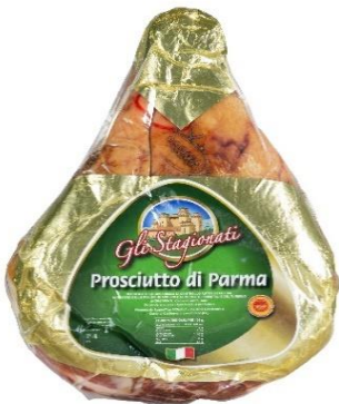
PROCIUTTO DI PARMA ADDOBBO E PIATTO G116/G113