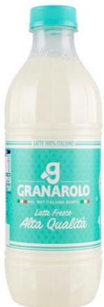
LATTE FRESCO GRANAROLO A.Q. 9720