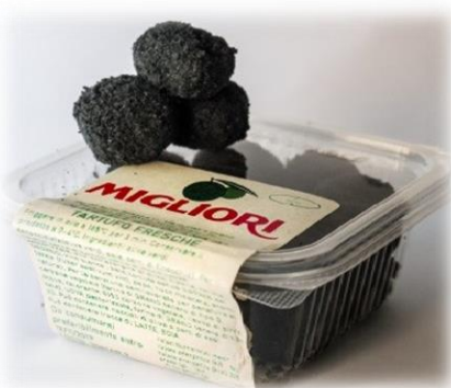
OLIVE ALL'ASCOLANA AL TARTUFO MI498