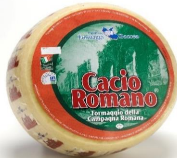
CACIO ROMANO A05