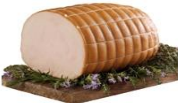
FESA DI TACCHINO G661