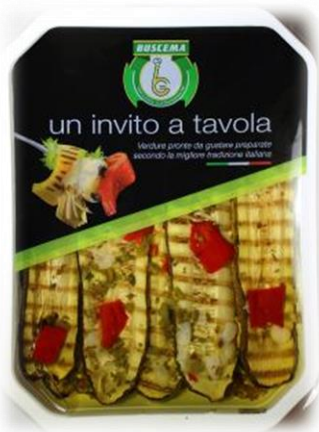
ZUCCHINE GRIGLIATE B154