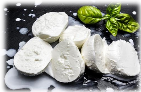
MOZZARELLA IN ACQUA FIOR DI DOLCEZZA 100 GR x 25 LE725