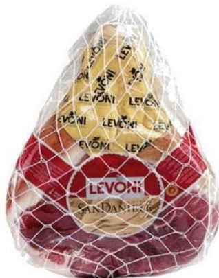
PROSCIUTTO SAN DANIELE PIATTO LV1116