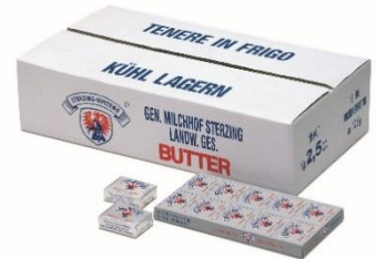
BURRO HOTEL U15/U7851