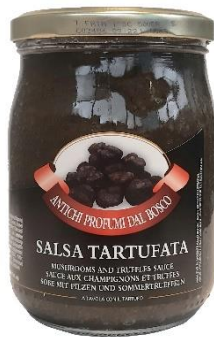
SALSA AL TARTUFO 500GR UT486/V705