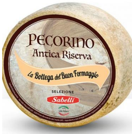
PECORINO ANTICA RISERVA LQ01