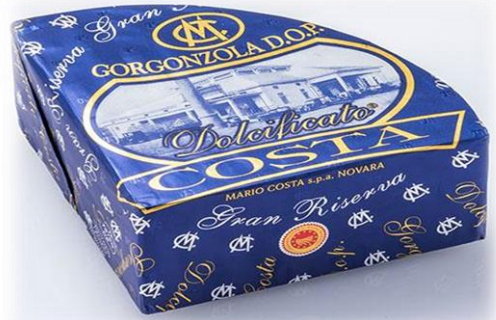
GORGONZOLA COSTA DOP X1250