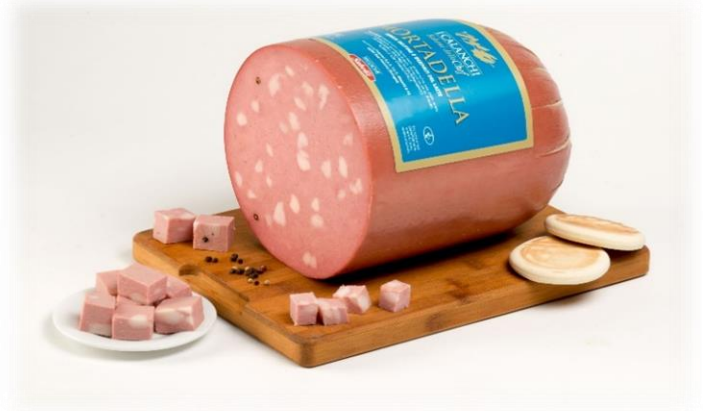
MORTADELLA CHEF CON E SENZA PISTACCHIO FE198/FE759/FE859