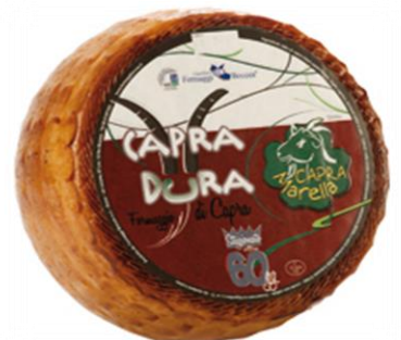
CAPRA DURA A09