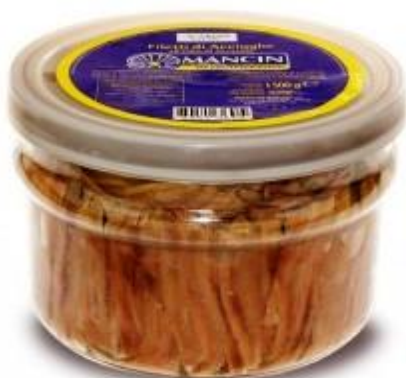
FILETTI DI ALICI 1,5 KG B709