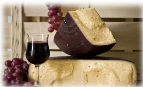
FORMAGGIO UBRIACO CA258