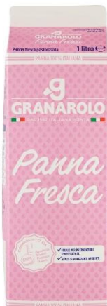
PANNA FEESCA GRANAROLO U6042