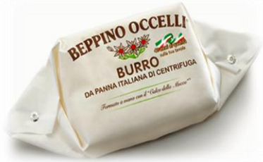
BURRO OCCELLI 100GR/200GR/3KG OC1/OC2/OC2B