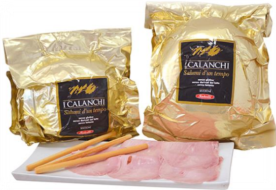
COTTO ORO INTERO E A META' G217/G218