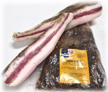
GUANCIALE TRADIZIONALE AL PENE NERO G390