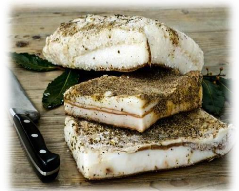
LARDO STAGIONATO B090