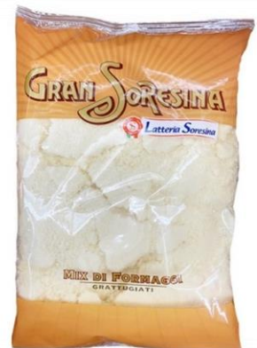
MIX DI FORMAGGI GRATTUGIATO 1 KG 2231