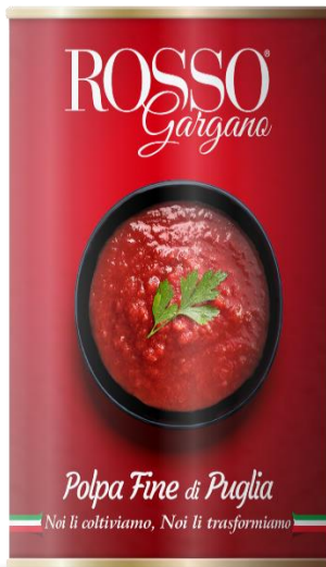
POLPA FINE 5KG IN LATTA RG03