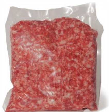
IMPASTO SALSICCIA G019