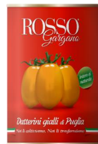
DATTERINO GIALLO 400 GR RG05