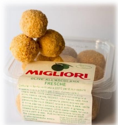
OLIVE ALL'ASCOLANA MI001