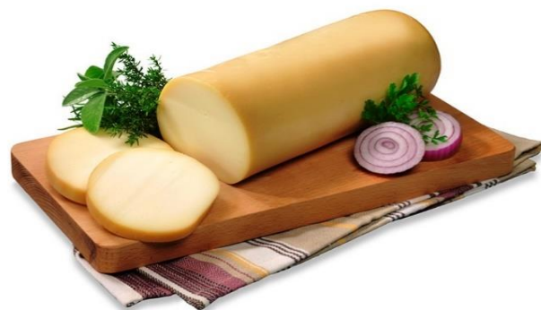
FILONE PROVOLA AFFUMICATO E BIANCO L431\L430