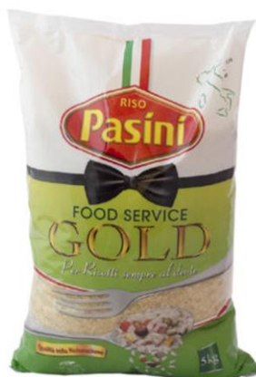
RISO ARBORIO E PARBOILED 5 KG V11/V12