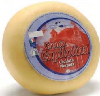
CREMA CAPITOLINA A13