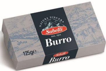
BURRO 125 GR/250 GR/1 KG U125/U250/U10