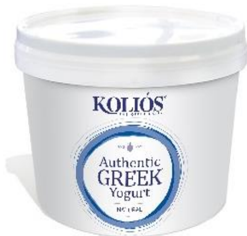
YOGURT GRECO 10% SECCHIO 5 KG KL020