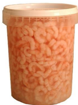
GAMBERETTI 900GR R1318