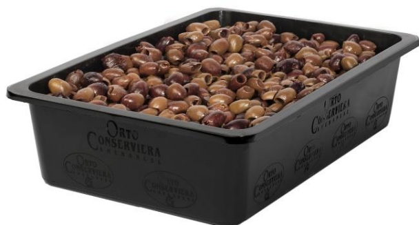
OLIVE TAGGIASCHE DENOCCIOLATE E NON OR14/B802