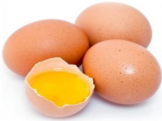
UOVA SFUSE M ED L NORMALI E SPECIALI EU0103/EU0121/EU0105/EU6337