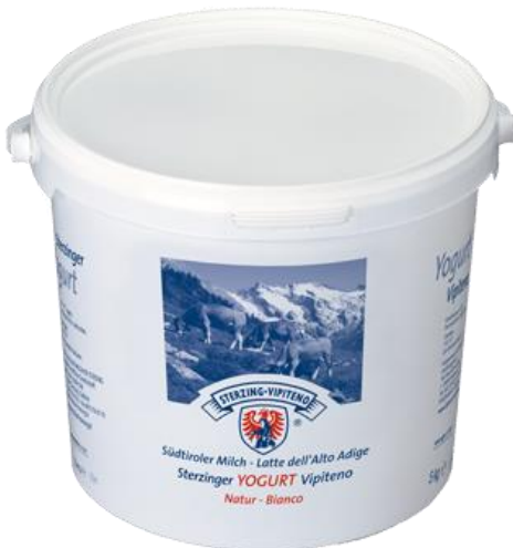
YOGURT INTERO E MAGRO SECCHIO 5 KG U7078/U7079