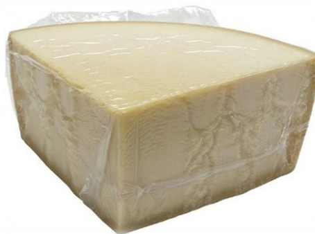
FORMAGGIO DURO ITALIANO 1/8 2213