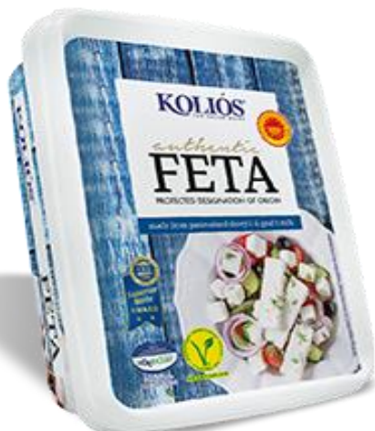
FETA GRECA 200GR \ 2 KG KL059\KL013