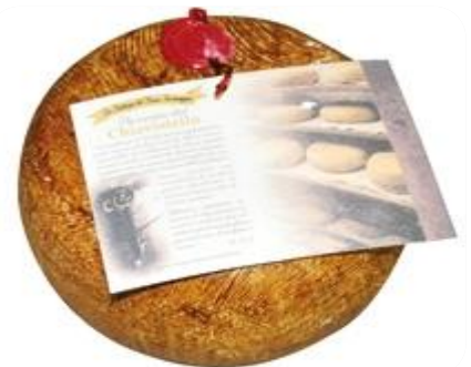
PECORINO CHIAVISTELLO SD189