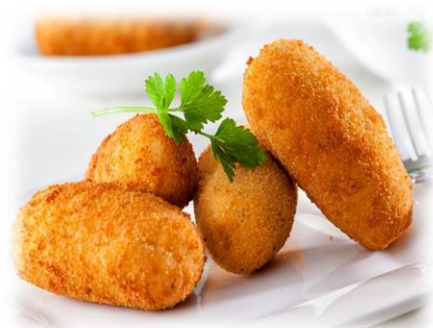
CROCCHETTE DI PATATE 90GRx18 AS161