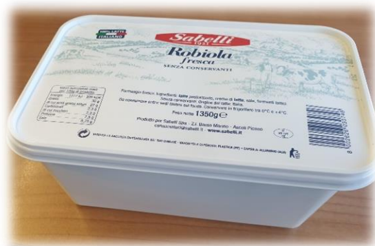
ROBIOLA 1,35 KG L74