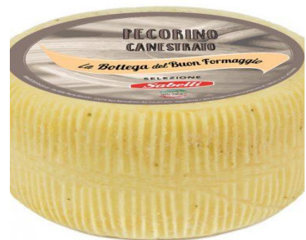
PECORINO CANESTRATO 8169B