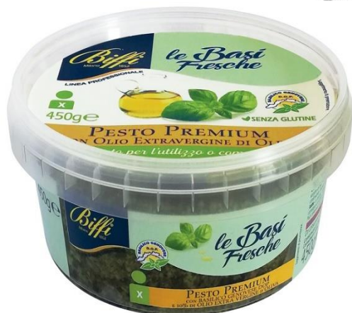
PESTO PREMIUM GR 450 T0036