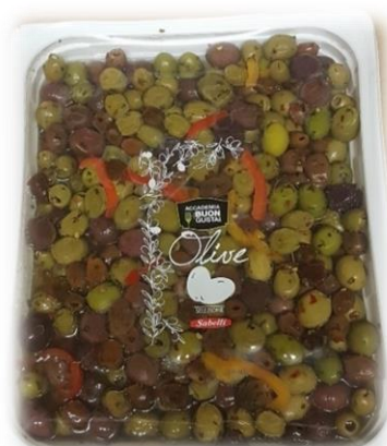
COCKTAIL DI OLIVE V1932