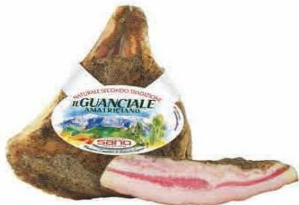
GUANCIALE AMATRICIANO SANO 9476