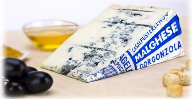
GORGONZOLA CROCE DOLCE E PICCANTE Z5/Z2