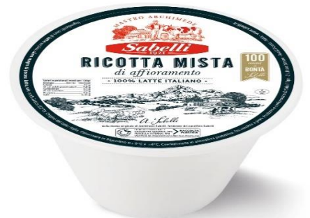
RICOTTA MISTA 1,5 KG L18