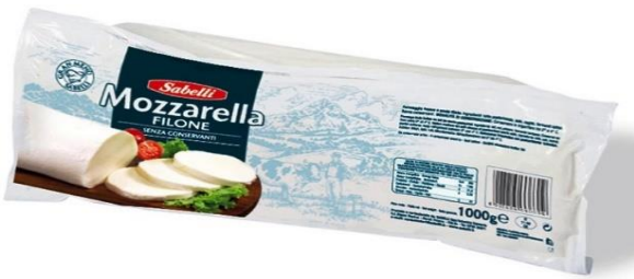
SILURO SABELLI 1KG L311