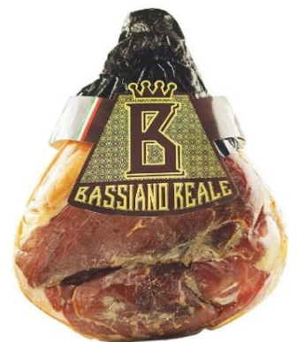
PROSCIUTTO DI BASSIANO PIATTO E ADDOBBO PB03/PB04