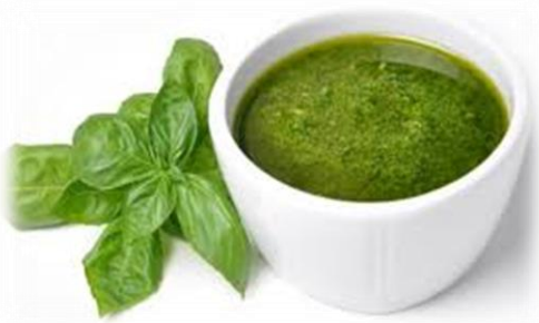
PESTO ALLA GENOVESE CON E SENZA AGLIO T01/T02/T05