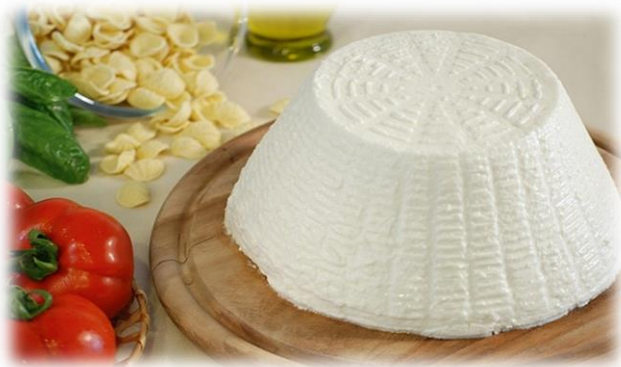
RICOTTA DI PECORA 2 KG CA12