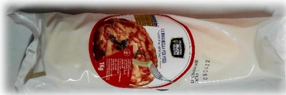
SILURO ACCADEMIA B.G. 1KG LE018