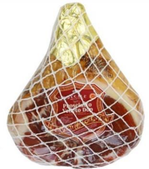
DISSOATO VENETO DOP ADDOBBO E PIATTO GU249/GU250