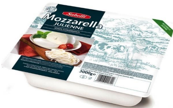
JULIENNE SABELLI 3 KG L480