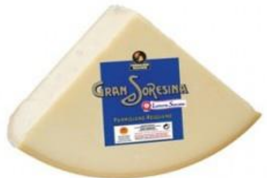
PARMIGGIANO REGGIANO 1/8 Q213