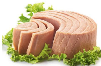
TONNO SOTT'OLIO D'OLIVA E GIRASOLE V166/2163