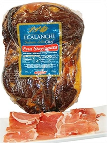
CRUDO CHEF G021S/PL05