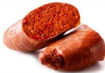
NDUJA DI SPILINGA G222