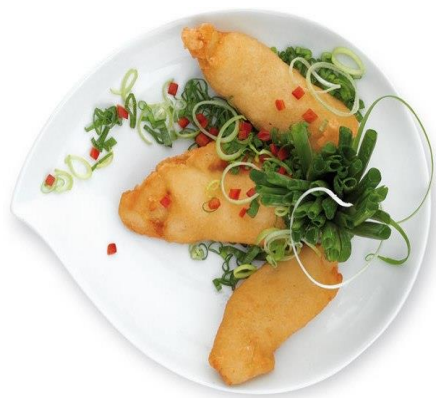
FILETTO DI BACCALA' 700 GR AS272