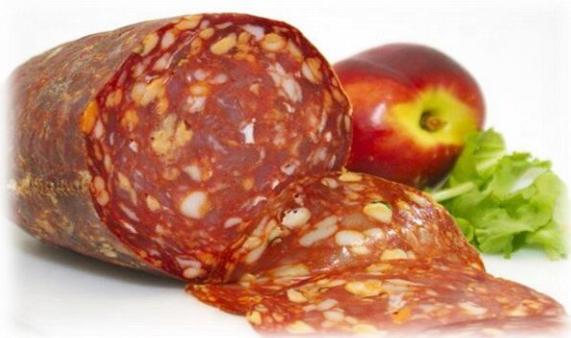
SALAME TIPO VENTRICINA G243