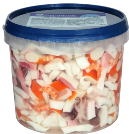
INSALATA DI MARE AL NATURALE 3KG B712