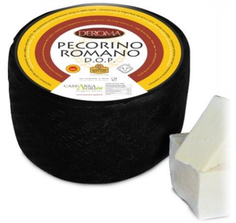
PECORINO ROMANO AGRIN CA054\CA053