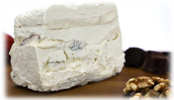
GORGONZOLA AL MASCARPONE CROCE Z7