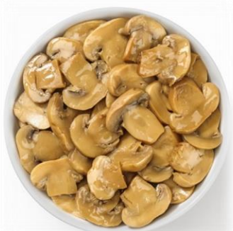
FUNGHI CHAMPIGNON AL NATURALE 2,5 KG Z139