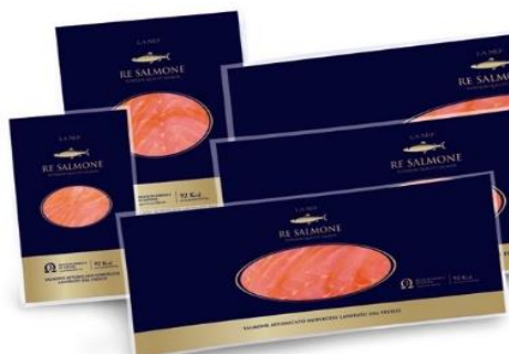
SALMONE AFFUMICATO 100GR/200GR/RITAGLI R5242/R5144/0264