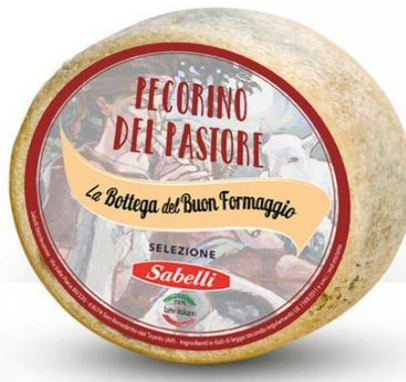
PECORINO DEL PASTORE 8169A