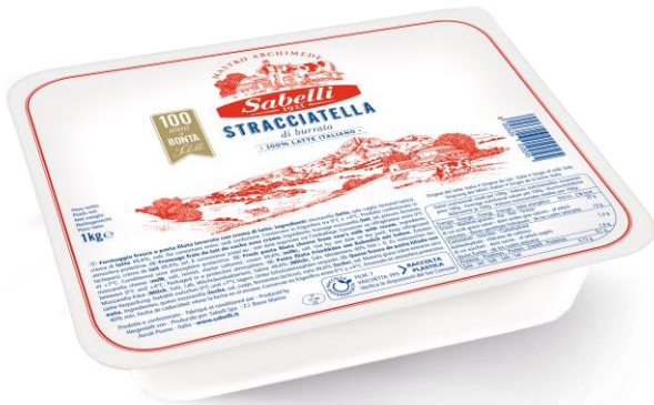
STRACCIATELLA DI BURRATA 250 GR/1 KG/3 KG L822/L820/L820V