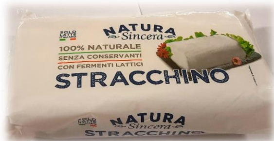
STRACCHINO DA LAVORAZIONE 1 KG \ 3 KG L8046 \ LB01