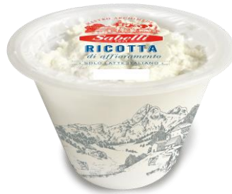
RICOTTINA AFFIORATA 300 GR L794