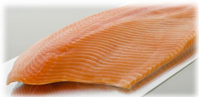
BAFFA SALMONE AFFUMICATO NORVEGESE E SCOZZESE R3015/R3055/R2055R/R5605