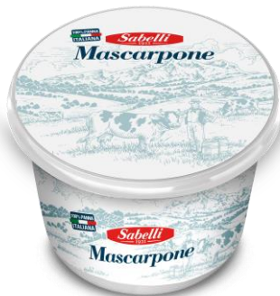
MASCARPONE 250GR/ 500 GR/ 2 KG L47/L16/L87