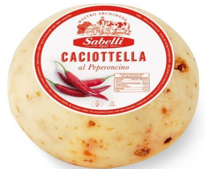
CACIOT. VACCINA AL PEPERONCINO LH212