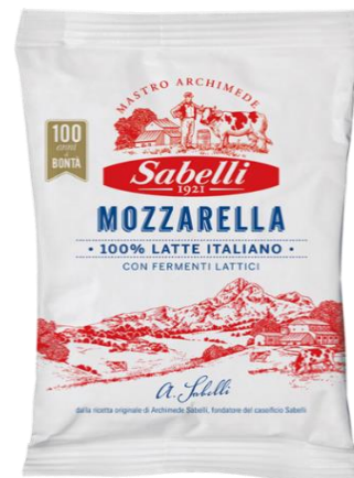
FIOR DI LATTE GRAN SASSO GR. 300/200 L9/L5