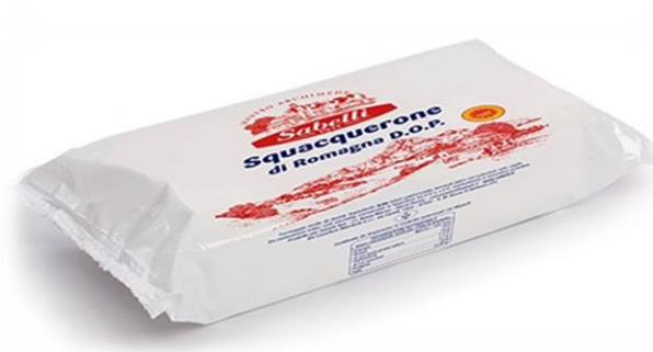
SQUACQUERONE DOP 250 GR \ 800 GR L65\L64