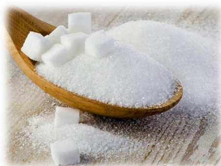
ZUCCHERO ERIDANIA 1 KG V29