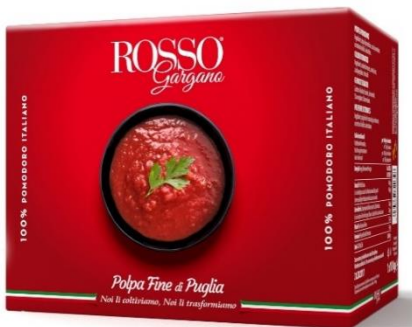
POLPA FINE IN BAG 10 KG RG04