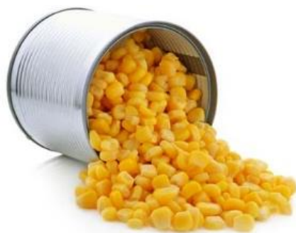
MAIS DOLCE IN LATTA 1,8 KG E 425 GR Z105/V841