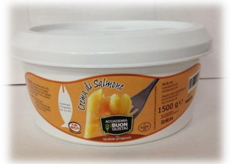
CREMA AL SALMONE 1KG B041