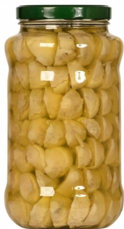
CARCIOFI SOTT'OLIO SPACCATI 3,1 KG Z102