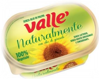
MARGARINA 250 GR/ 1KG K027/9114