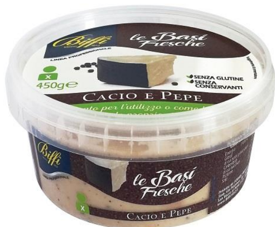
SUGO CACIO E PEPE GR 450 T0039