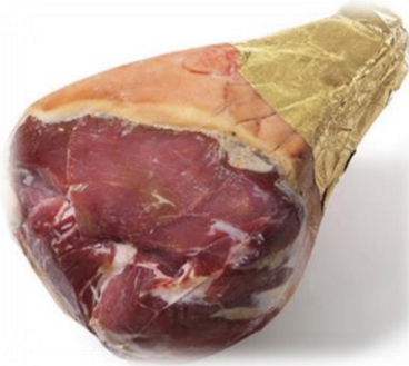
DISSOATO ESTERO ADDOBBO E PIATTO 9119A/9119B