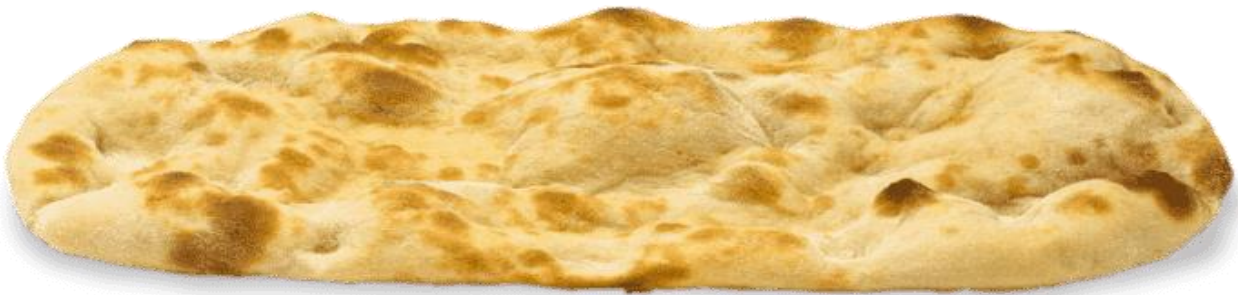
BASI PER PINSA 250GR SD208/SD407