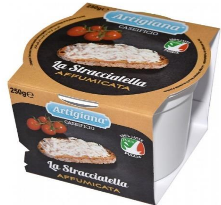
STRACCIATELLA AFFUMICATA 250 GR/1 KG AR0820/AR0811