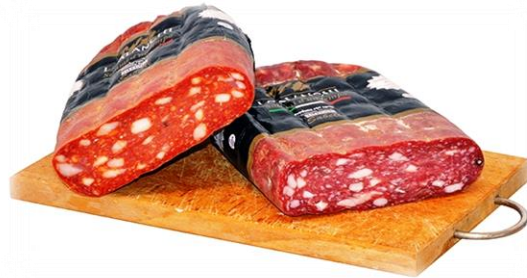
SPIANATA ROMANA DOLCE E PICCANTE G250/G251