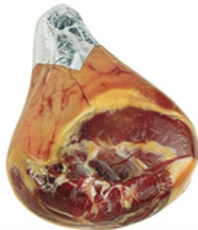
DISSOATO NAZIONALE ADDOBBO E PIATTO GU49/GU50