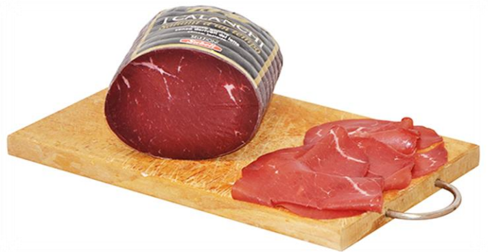
BRESAOLA PUNTA D'ANCA E CHEF G03/G04/9202