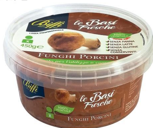
SUGO AI FUNGHI PORCINI GR 450 T0041