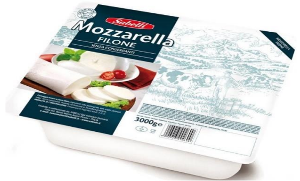
SILURO SABELLI IN ACQUA 1KG L479