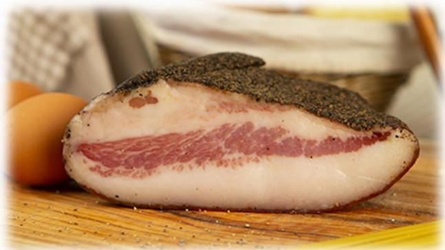
GUANCIALE AL PEPE NERO PM9460