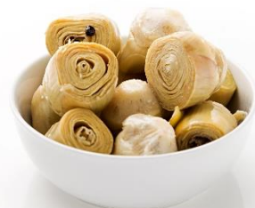
CARCIOFI AL NATURALE 30/40 IN LATTA Z119