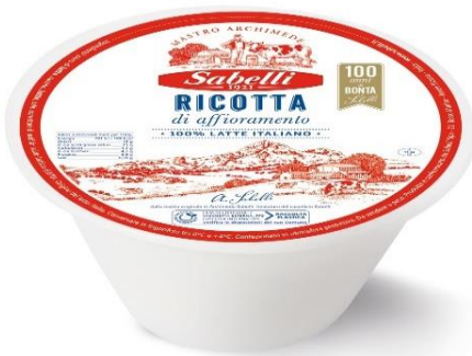
RICOTTA VACCINA D'AFFIORAMENTO 1,5 KG L349