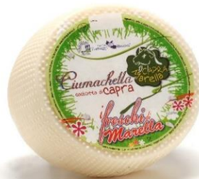
CIUMACHELLA DI CAPRA A08