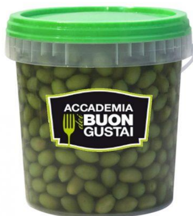
OLIVE VERDI GIGANTI GRECHE E ITRANE B817/B818/B819