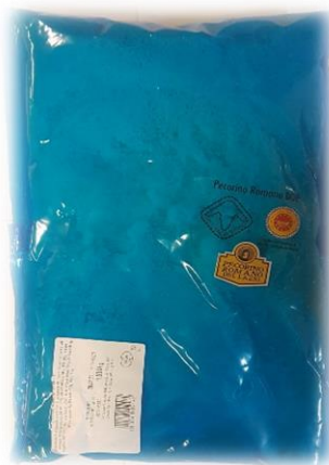
PECORINO ROMANO GRATTUGIATO DOP AG71G