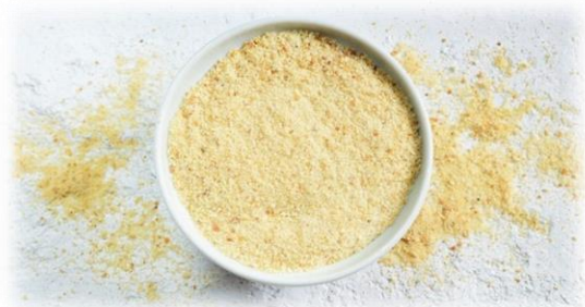
SEMILAVORATO PER PANATURA 0431